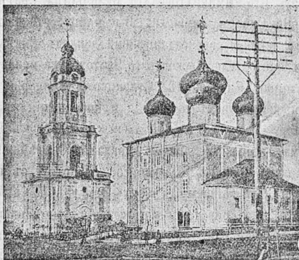
Тверской кафедральный соборъ.