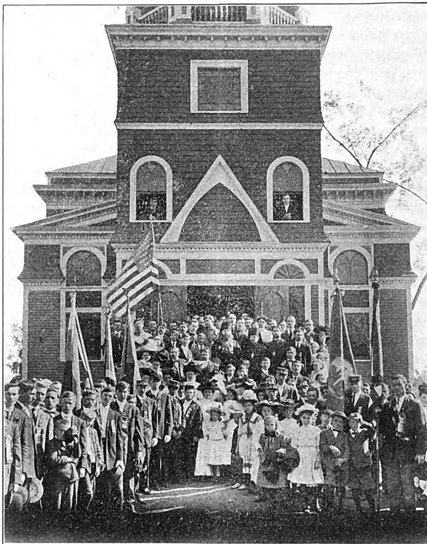
Высокопр. Владыка Платонъ, духовенство и народъ по выходѣ изъ Ватерб. церкви послѣ торж. освященія и Литургіи.

рыя, по преданію, падая съ лика Божественнаго Страдальца Христа на землю, выросли въ благоуханныя розы... Когда то изнемогавшему Христу посланъ былъ въ Геосиманскомъ саду Ангелъ для ободренія: пришелъ нынѣ и на помощь Вотерберійцамъ ангелъ ободряющій и дающій силы, въ образѣ нашего Архипасты-