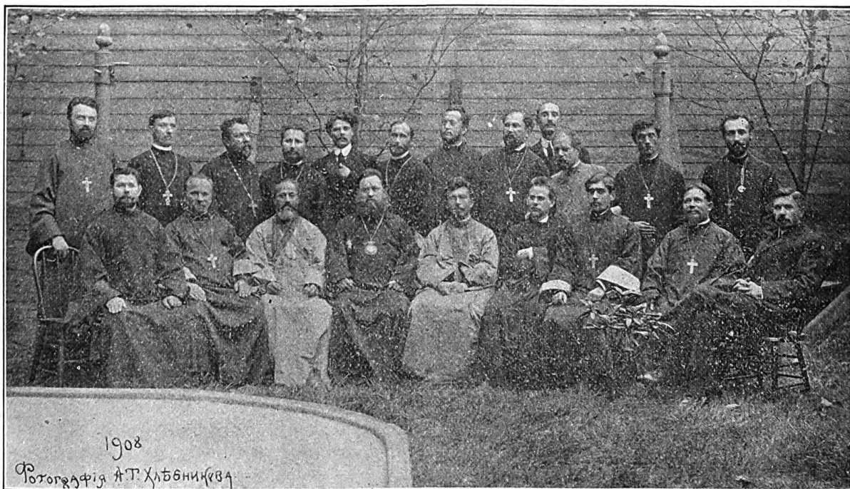
Высокопреосвященнѣйшій Владыка Платонъ и духовенство — въ день годовщины пріѣзда Архипастыря въ Америку.

почти одинъ противу всего стана вражя... И попрали силу вражю. Глянулъ красное Солнышко: нужны богатыри и въ далекой странѣ, за океанъ—моря глубокия брошенной. И тамъ на душу христіанскую, на сердце русское ополчается сила лютая, соловьи разбойники. И кликнулъ кличъ ко всей Русской Церкви богатырямъ—святителямъ Красное Солнышко: идите, богатыри, во страну ту дальнюю, вызволяйте отъ плѣну тяжкаго, грѣховнаго, отъ полона духовнаго моихъ христіанъ — едино-