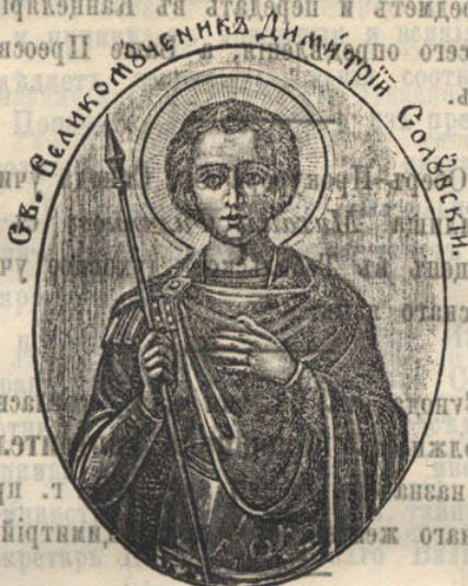
Св. великомученика Дмитрія Солдникаго

Подписка принимается въ Советѣ Братства, въ г. Тобольскѣ.