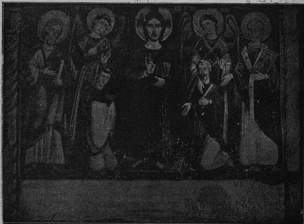
Фреска на стѣнѣ нижней церкви св. Климента (Иисусъ Христосъ благословляетъ коленнопреклоненныхъ святыхъ Кирилла и Меѳодія).

слѣпотствующія очи языческой Руси, въ лицѣ равноапостольнаго князя Владиміра, подъ сводами Херсонесскаго храма вошедшаго въ купель слѣпымъ и вышедшаго изъ нея прозрѣвшимъ, гдѣ слухъ ея наполнится глаголами живота вѣчнаго на понятномъ, родномъ языкѣ,—на Инкер-