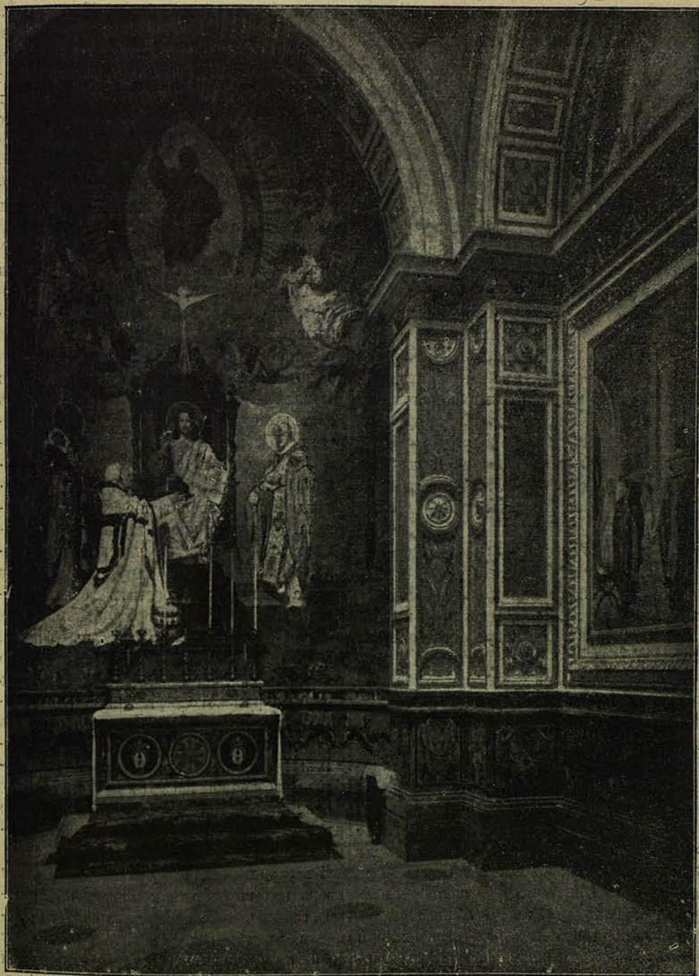
Видъ алтаря въ капеллѣ святыхъ Кирилла и Меѳодія.