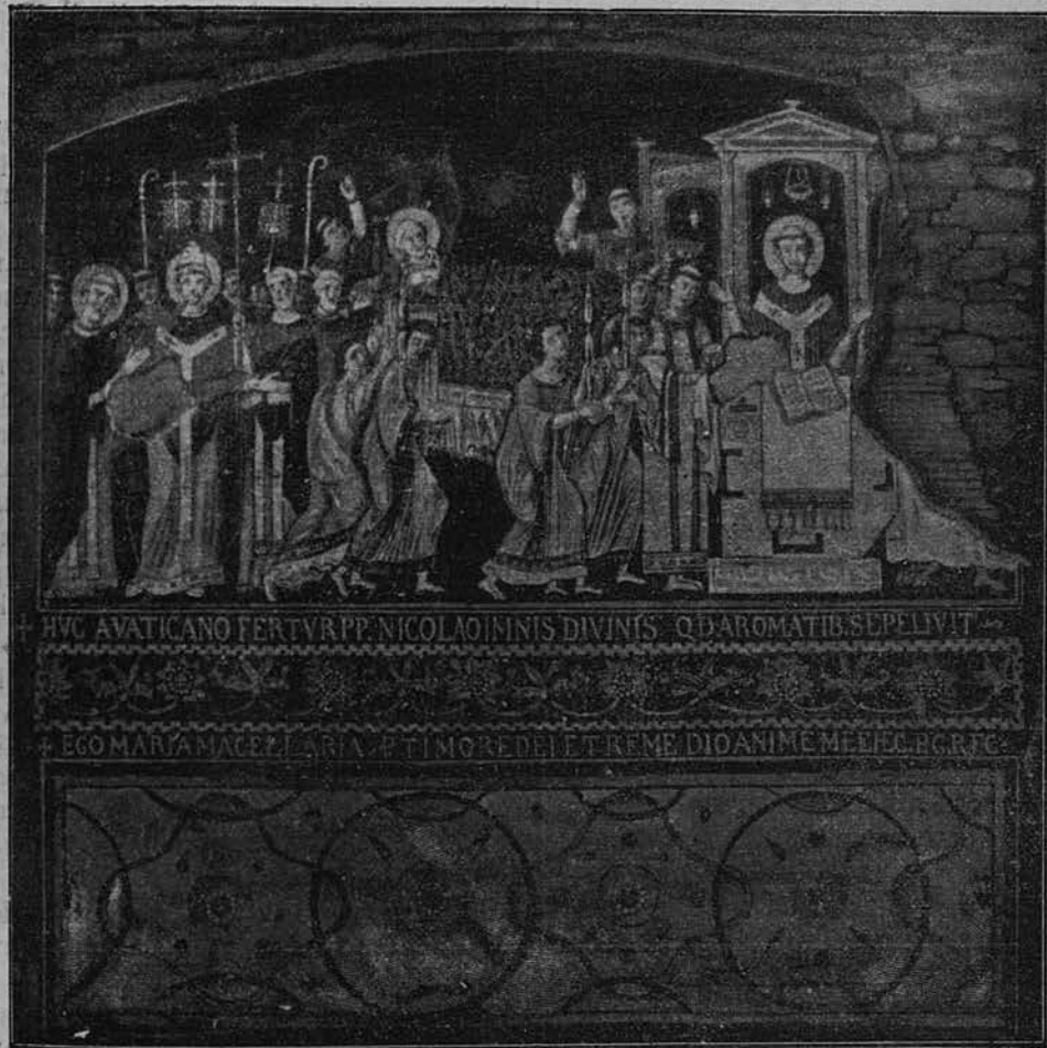
Фреска въ церкви св. Климента изображающая торжественное перенесеніе тѣла св. Кирилла изъ Ватикана въ церковь св. Климента для погребенія.

правственнаго состоянія, залогъ нашего будущаго развитія и преуспѣянія, а вмѣстѣ условіе нашего политическаго значенія. Если русскій народъ не совершенно загрузѣлъ, не лишился человѣческаго образа ни вслѣдствіе почти трехсотлѣтняго монгольскаго ига, ни вслѣдствіе