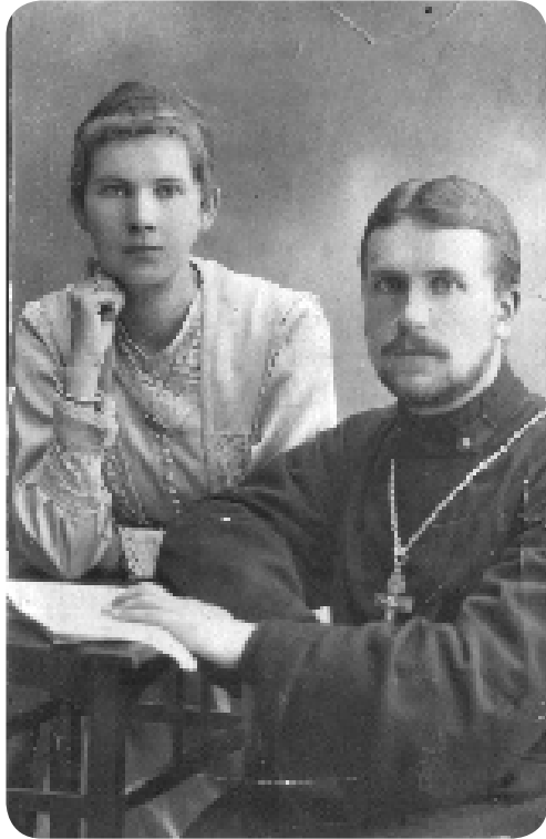
Вскоре после свадьбы. Август 1917 г.