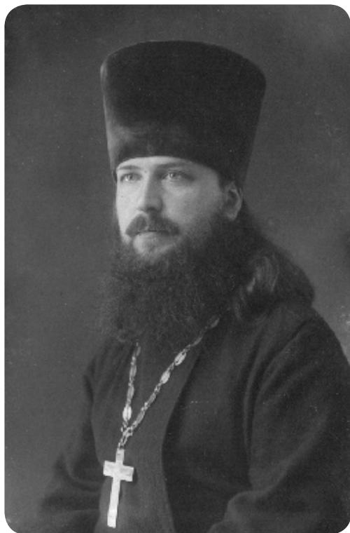
Таким отец был в год моего рождения (1928 г.)