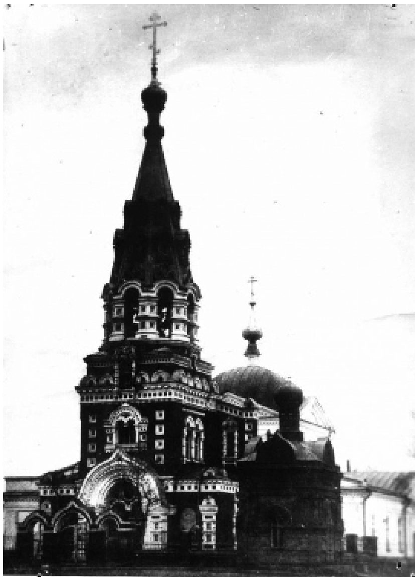
Покровский собор г. Сенгилея. Фото 1914 г. Затоплен при создании Куйбышевского водохранилища