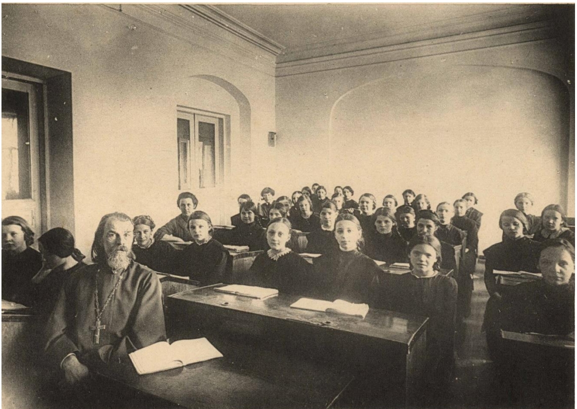
4-ый классъ основн. на урокѣ