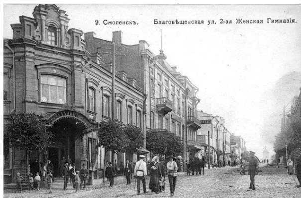
Вторая женская гимназия. Вид здания сегодня и в начале XX века.

Учебное заведение для девочек, находившееся напротив купеческого собрания, называлось просто: «2-я женская гимназия». Своим возникновением она была обязана... совершеннолетию последнего российского императора.