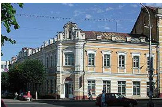
ул. Большая Советская, 27/20 - 2-я женская гимназия