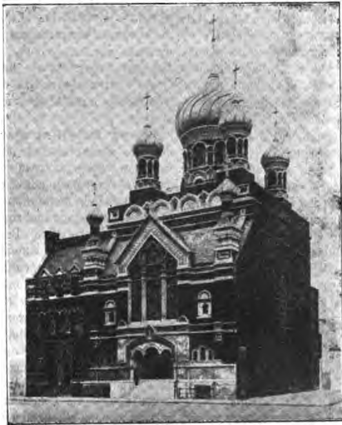
Русскій православный храмъ въ Нью-Йоркѣ.