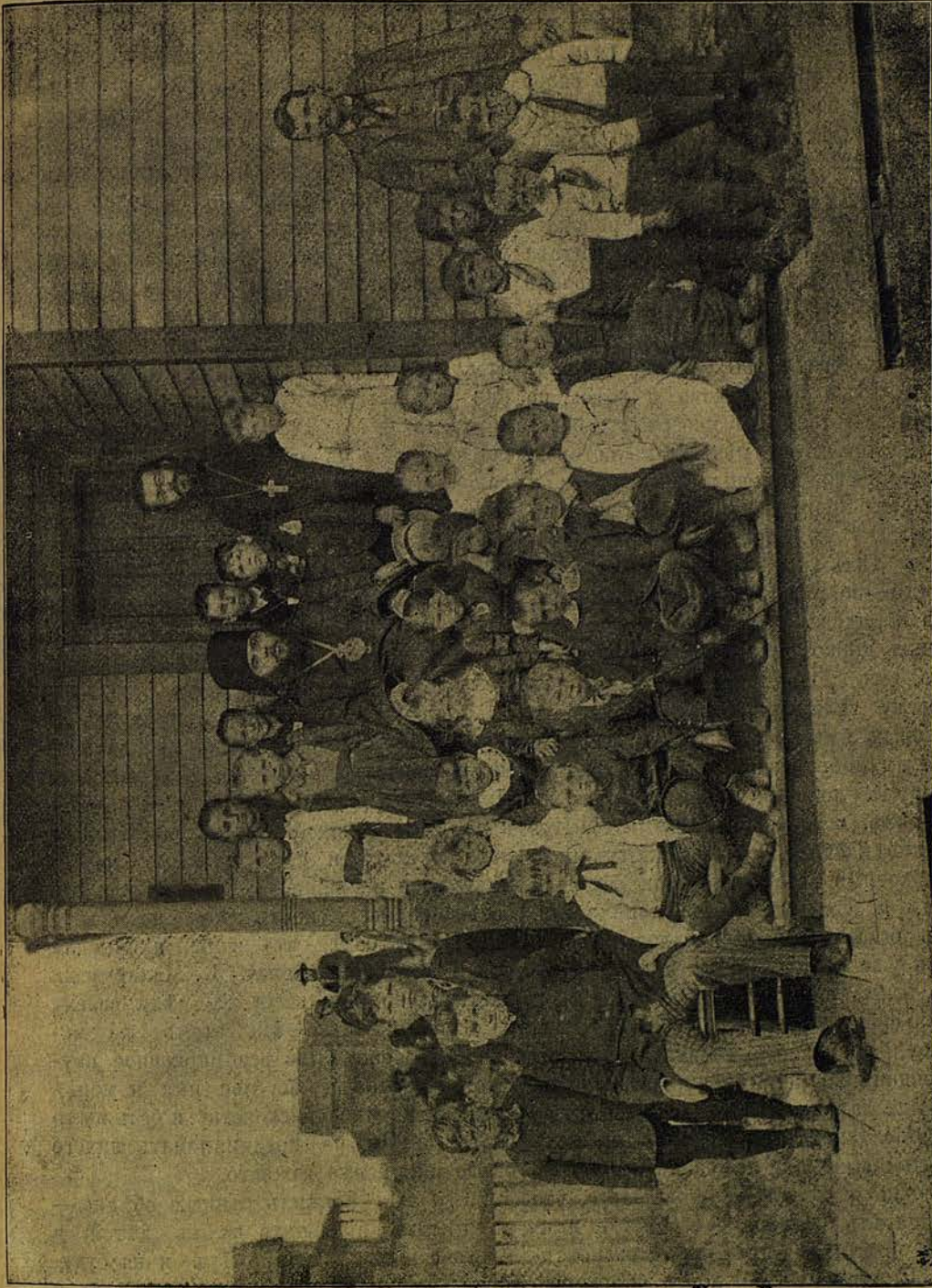
Миннеаполисская церковно-приходская школа. (отпр. 6—18 декабря 1892 г.).