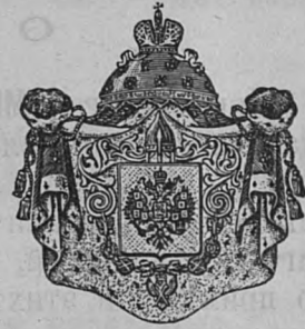
Цоставщикъ Двора Его Величества.