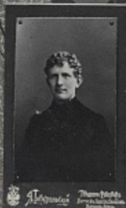
BOHEMIA. Stars vs. place Bohemia.