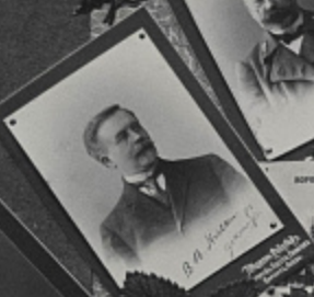
BOHEMIA. Stars vs. place Bohemia.