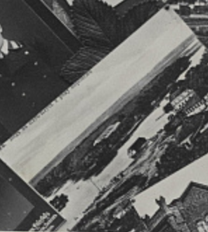
BOHEMIA. Pictures Bohemia.