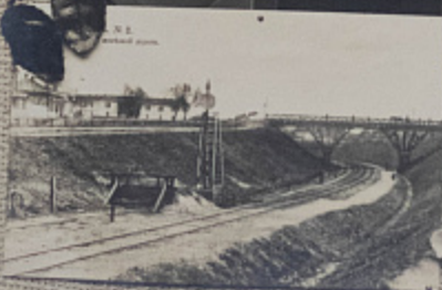
В. В. Е.