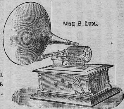
Мод. В. Lux.

Чтобы дать возможность приобрести дѣйствительно чудный подарокъ къ празднику, мы предлагаемъ за баснословно дешевую цѣну: