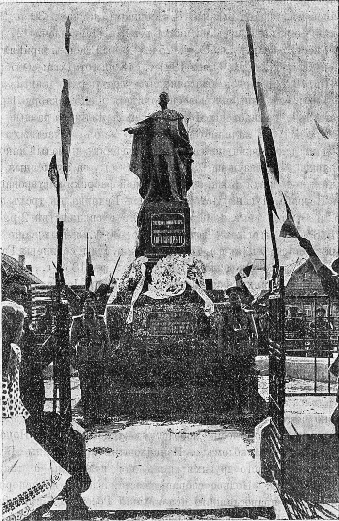
Памятникъ Императору Александру II-му въ с. Алатахъ, Казанскаго уѣзда.

Предъ входомъ во храмъ «любовію населенія Алатской, Атнинской и Менгерской волостей въ память освобожденія крестьянъ и 300-лѣтія царствованія Дома Романовыхъ поставленъ 14 мая 1914 года» и открытъ 25 мая памятникъ Царю-Освободителю.