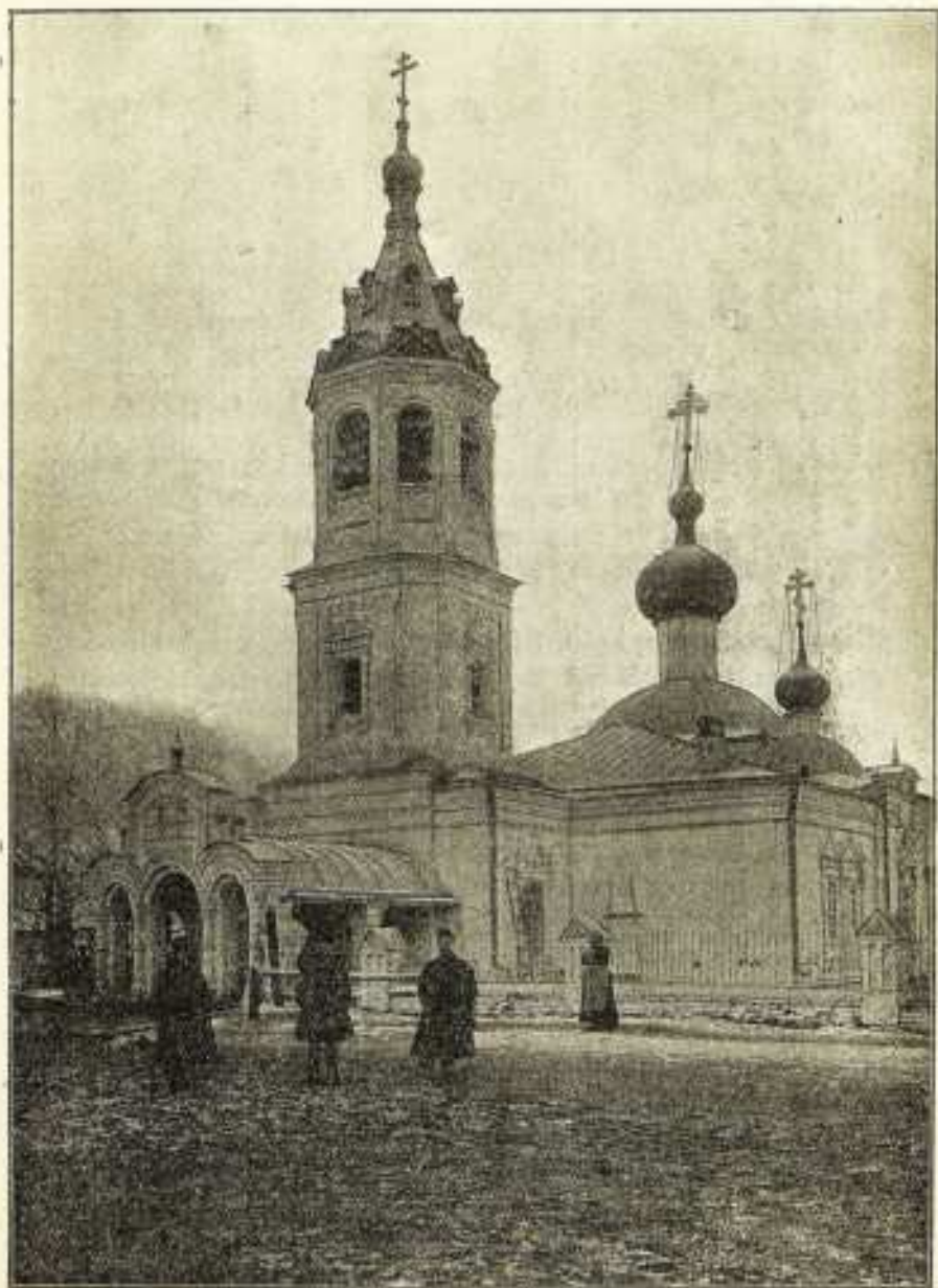
Храмъ соли Альтъ.