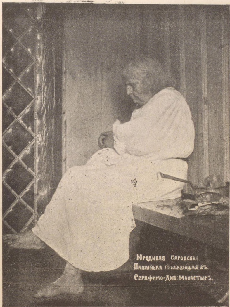
Юрдивья Саровская Пашинька проглядывшая въ Серфимо-Див. Монастырь.