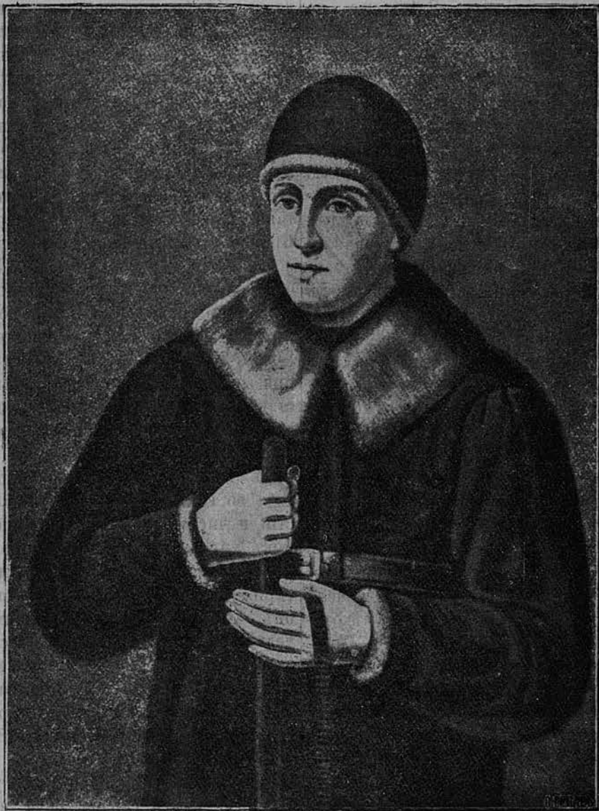
Первоначальница Дивѣвской общины Агафія Симеоновна Мельгунова, въ монашесствѣ мать Александра.

накомъ съ узелкомъ. А какъ идетъ, бывало, то госпожи великія ведутъ ее подъ руки. Столь за жизнь свою была уважаема».