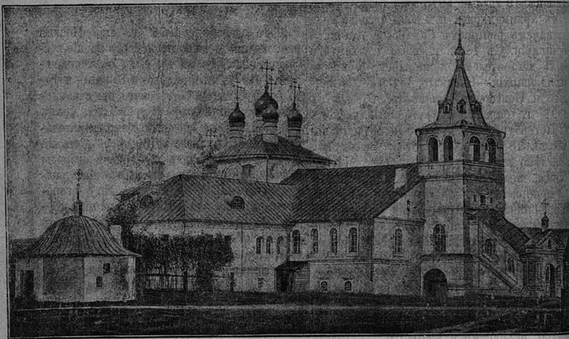
Видъ Успенскаго монастыря въ г. Александровѣ съ келліями Царя Іоанна Грознаго.

Къ статьѣ: Первоклассный Успенскій женскій монастырь въ г. Александровѣ (№№ 51—52 «Церк. Вѣд.» 1896 г., стр. 1927) *).