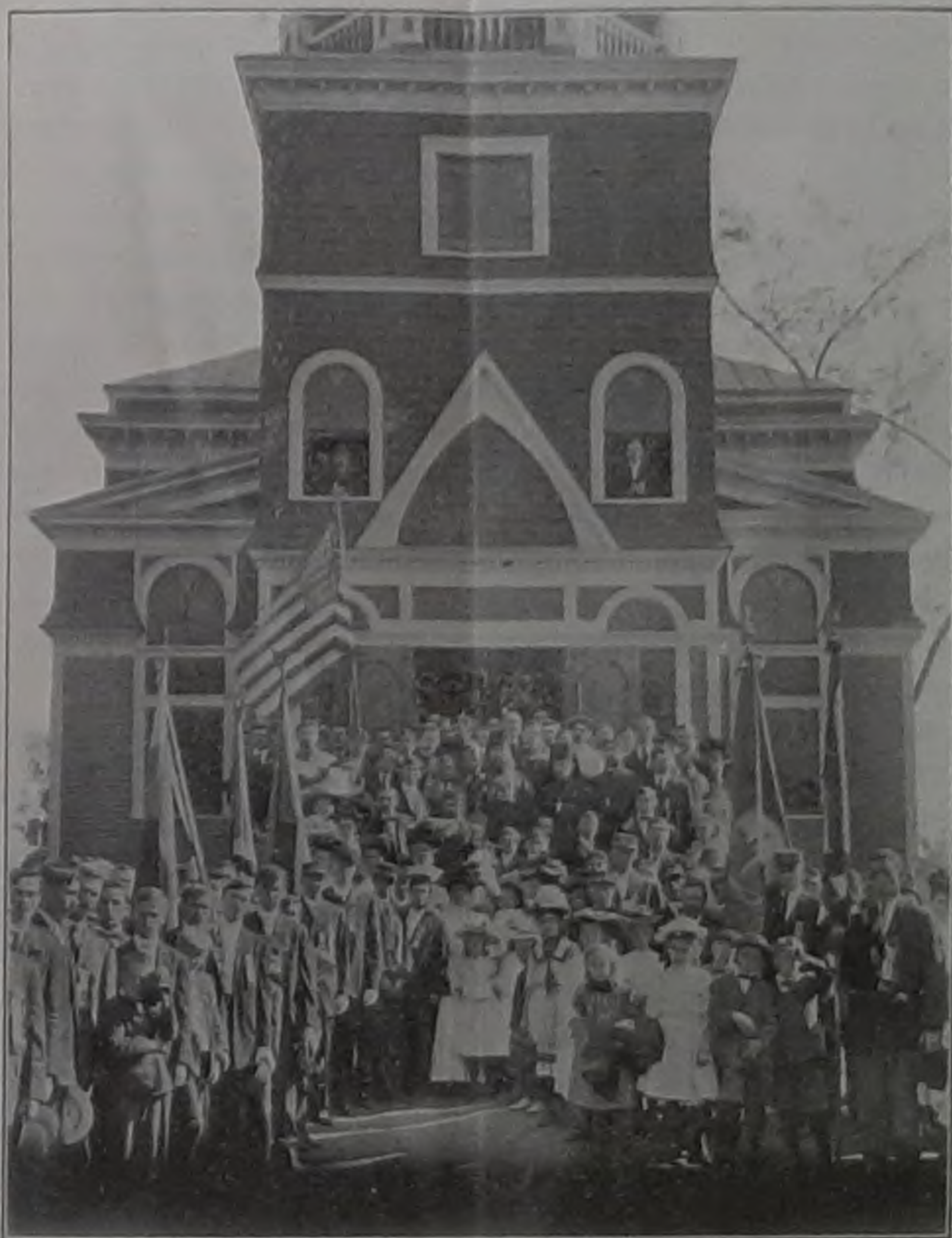
Высокопр. Владыка Платонъ, духовенство и народъ по выходѣ изъ Ватерб. церкви послѣ торж. освященія и Литургіи.

рыи, по преданію, падалъ съ дна Вознесеннаго Страдальца Христа на землю, выросли въ благоуханныя розы... Когда то панемогавшему Христу посланъ былъ въ Геосиманскомъ саду Ангелъ для ободренія: пришелъ ѡнъ и на помощь Вотерберійцамъ ангелъ ободряющій и дающій силы, въ образѣ нашего Архипасты-