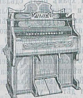
5 окт., 220 гол., 16 регистр., орѣховаго дерева. 250 руб. и дороже.