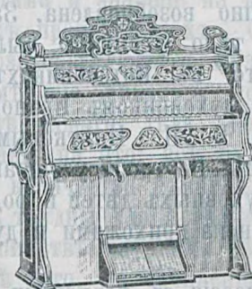
5 окт., 159 гол., 14 регистр. орѣховаго дер. . . 200 руб