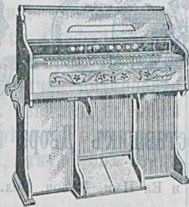
5 окт., 122 голося, 10 ре- гистр., дуб. дер. 150 руб. Такая же съ 11 рег. 160 р.