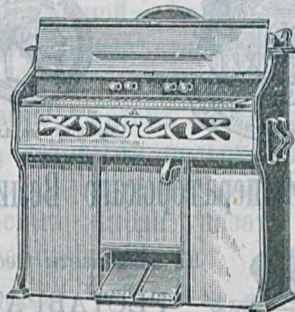
5 октавъ, 61 голось, 5 ре- гистр., дуб. дерева. 120 руб.

ПЕРВОКЛАССНЫХЪ ЗАГРАНИЧНЫХЪ ФАБРИКЪ КАРПЕНТЕРЪ, ШИДМАЙЕРЪ и СОБСТВЕННОЙ ФАБРИКИ ВЪ ЛЕЙПЦИГѢ (АМЕРИКАН. СИСТЕМЫ).