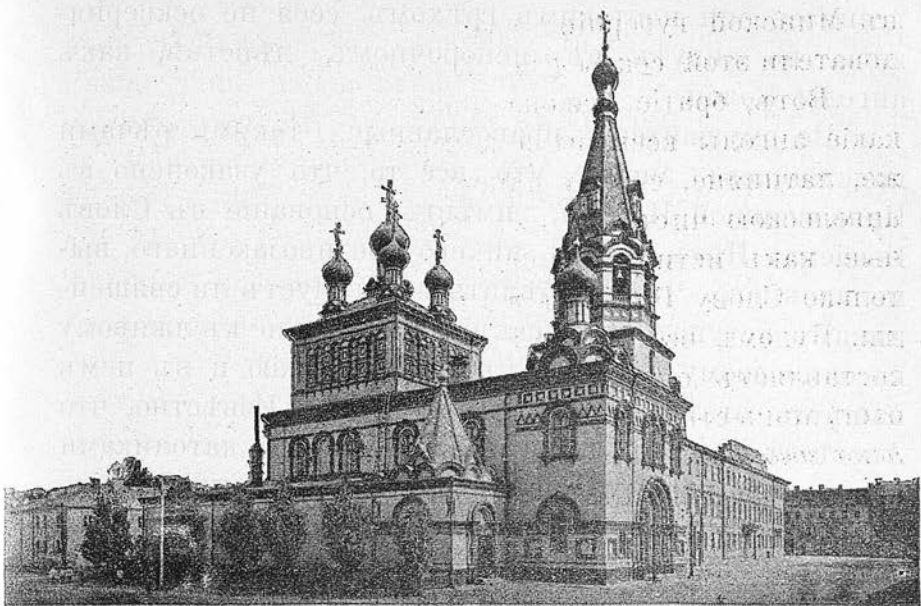
Каедральный Петропавловскій соборъ въ г. Минскѣ.