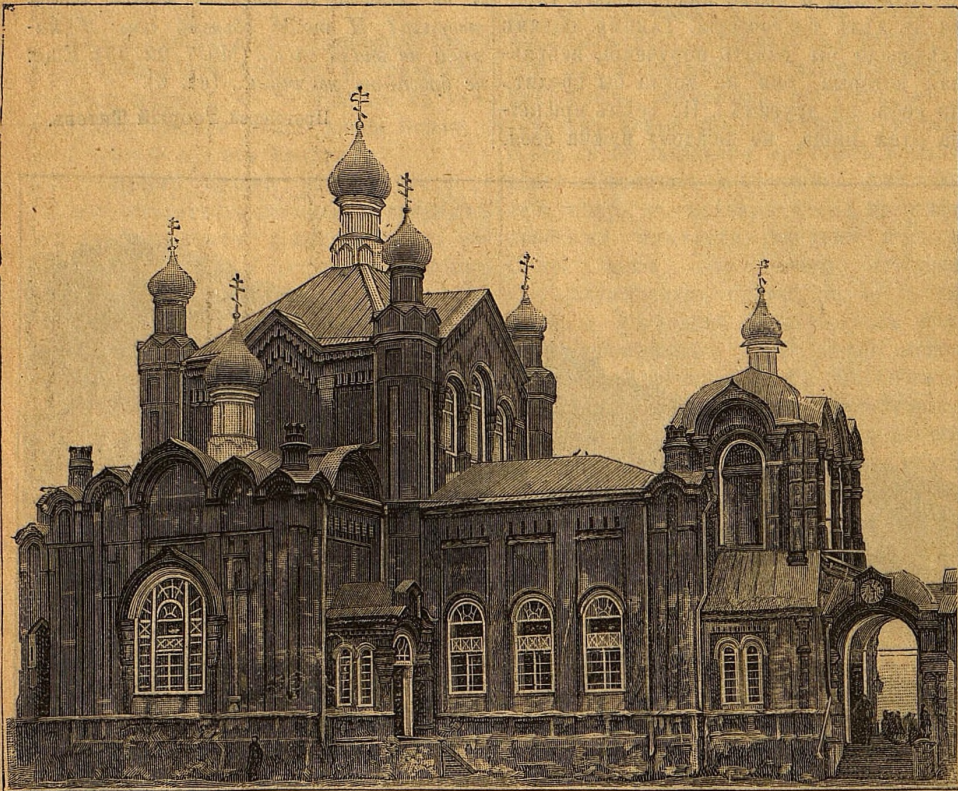
Церковь при архіерейскомъ домѣ въ г. Війскѣ.