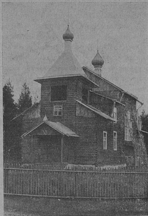
Наружный видъ храма.

Дер. Кангаспелто, а по мѣстному прозвищу — Новая Деревня, въ коей сооруженъ вышеуказанный храмъ, находится въ 10 верстахъ отъ главнаго — Кююрельскаго приходскаго храма. Правда, разстояніе это не велико, но т. к. жители деревни — люди большею частью бѣдные, не имѣющіе лошадей, то службы въ главномъ приходскомъ храмѣ, особенно въ зимнее время, посѣщались ими рѣдко, лишь въ большіе праздники, а дѣти даже и по нѣсколько лѣтъ оставались безъ св. причастія. Желая помочь жителямъ деревни въ этомъ отношеніи и поспособствовать развитію среди нихъ религіозной настроенности, причтъ Кююрельской церкви въ 1918 году взялъ себѣ за правило время отъ времени ѣздить въ дер. Кангаспелто и тамъ совершать богослуженія. Мѣстомъ для совершенія службъ былъ избранъ свободный классъ мѣстной народной школы. Жители деревни относи-