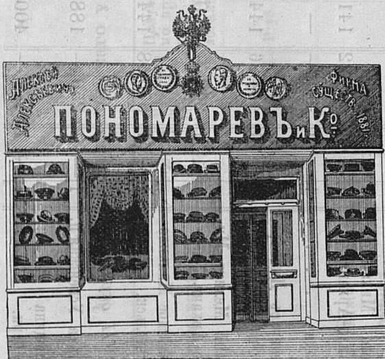
Саратовъ, Никольск. ул. д. Лютеранской церкви.

для священниковъ въ большомъ выборѣ шляпы, шапки цѣны недорогія.