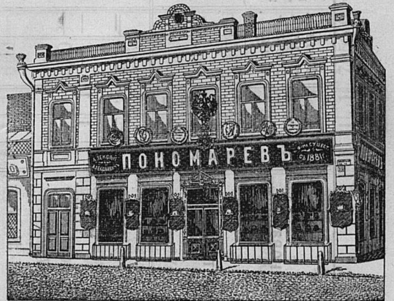
Самара, Дворянская ул. д. Лютеранской церкви.