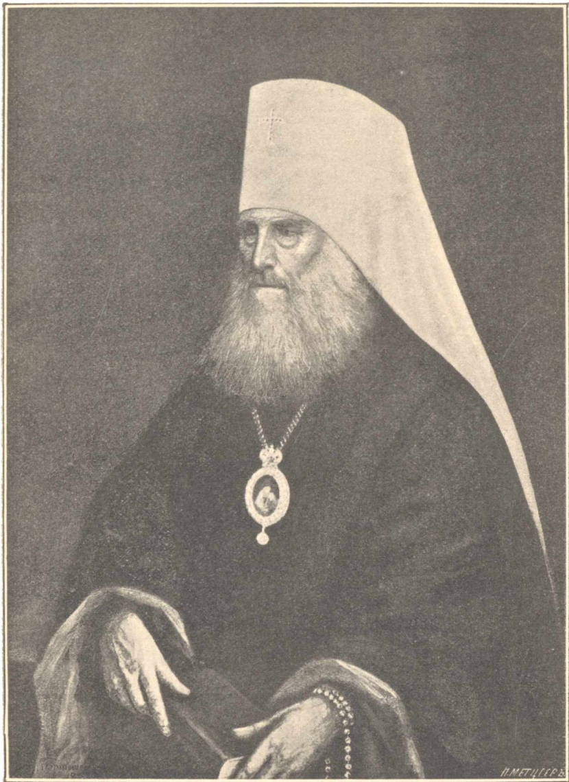
Высокопреосвященнѣйшій Митрополитъ Сергіѣ. Московскій и Коломенскій.

Фототипія съ портрета писаннаго г. Боргашевичемъ. Право воспроизведенія сего портрета представлено художникомъ исключительно Троицкой Сергіевой Лаврѣ, въ пользу страннопріимнаго Дома при оной Лаврѣ.