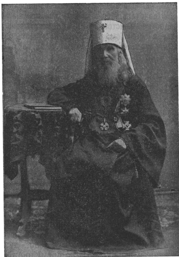
Высокопреосвященнѣйшій Макарій, Митрополитъ Московскій и Коломенскій.