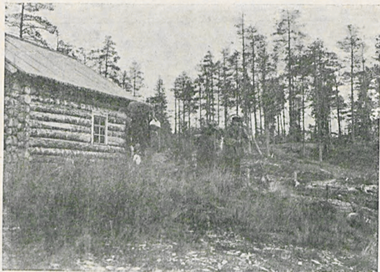
Видъ тундры лѣтомъ.

Единственнымъ признакомъ культуры являлась расположившаяся на видномъ мѣстѣ, въ хорошо сколоченномъ домѣ, блаженной памяти казенная винная лавка. Какая, однако, это была культура, и какъ ею пользовалось населеніе, было видно по валявшимся кое-гдѣ на камняхъ трупамъ охмѣлѣвшихъ до безчувствія рыбаковъ.