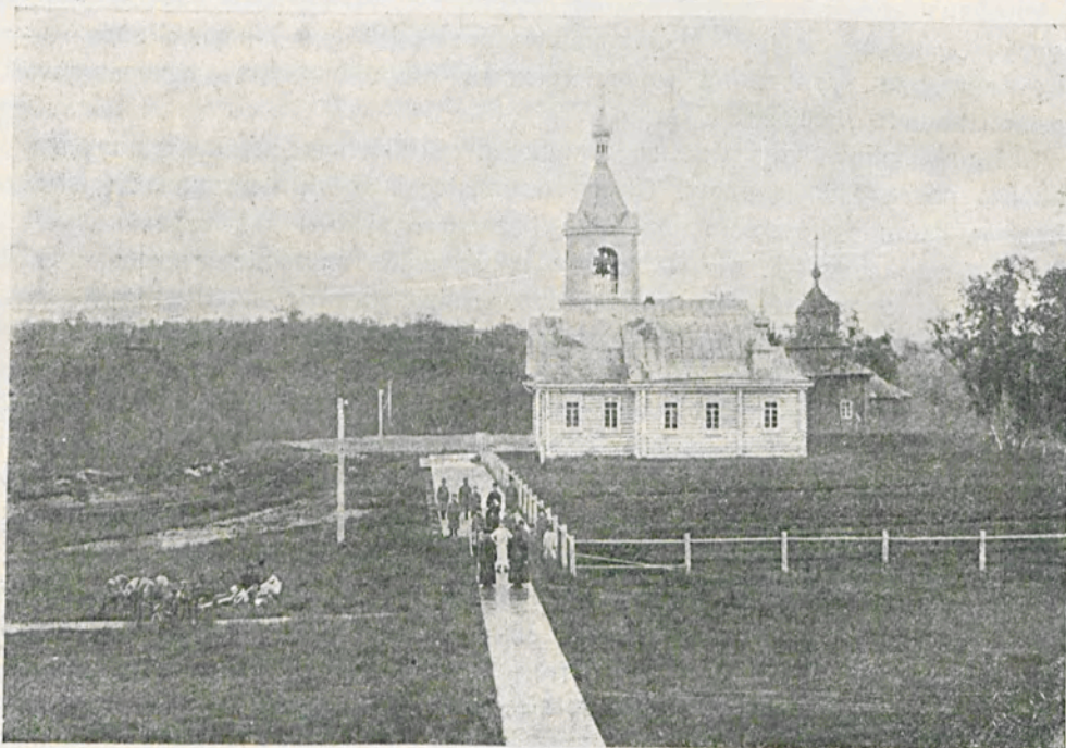
Монастырскій храмъ, пристроенный къ древней церкви.

Наконецъ, въ сферу хозяйственной эксплуатаціи Печенгскаго монастыря попала полярная гага, пухъ которой цѣнится очень высоко на рынкахъ. Добываніе этого пуха изъ гнѣздъ развито въ сѣверной Норвегіи; у насъ же въ Россіи первая попытка добыванія пуха сдѣлана о. Іонафаномъ, до котораго гага подвергалась почти полному истребленію на Муг-