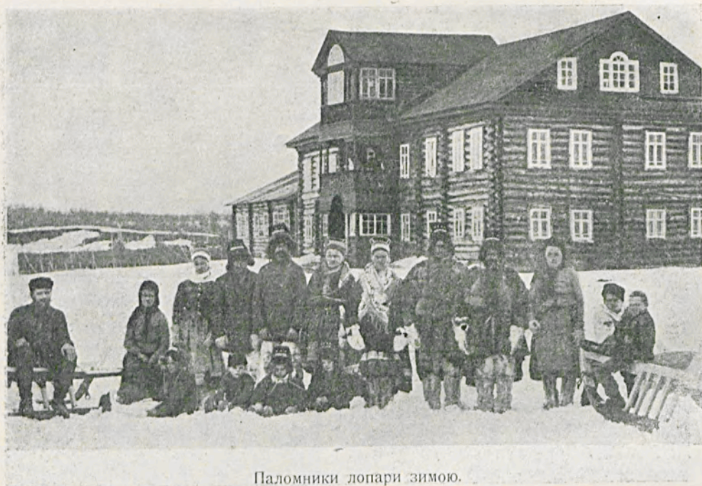
Паломники лопари зимою.

Кромѣ переданнаго монастыремъ въ вѣдѣніе министерства народнаго просвѣщенія начальнаго училища, монастырь открылъ приходскую школу для дѣтей инородцевъ съ пансіономъ, въ которой учатся дѣти окрестныхъ лопарей, а также зырянъ, кареловъ и финновъ-колонистовъ. Въ монастырь устраиваются чтенія для народа, иллюстрируемыя проекціоннымъ фонаремъ.