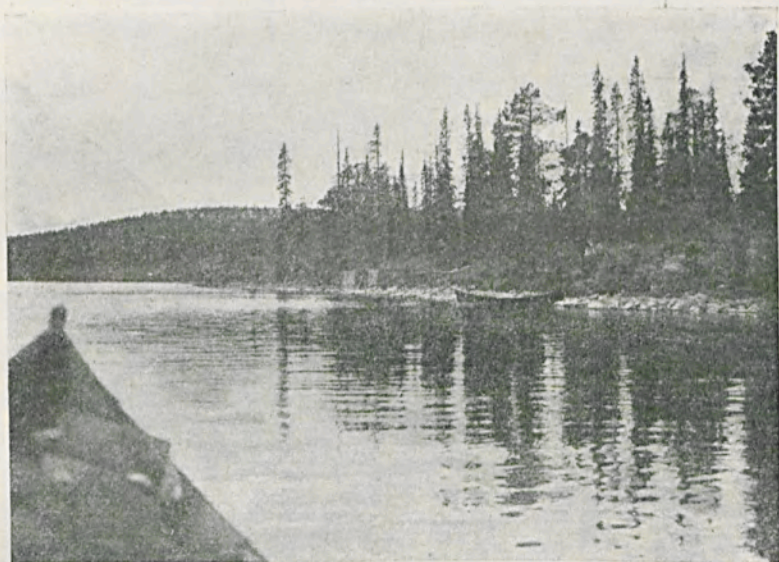
Видъ тундры лѣтомъ.

Мурманскій берегъ имѣетъ очень мало осѣдлаго населенія. Оживляется онъ нѣсколько лѣтомъ, когда на морскіе промыслы являются поморы промышленять треску. Приходятъ они главнымъ образомъ съ Кемскаго берега Бѣлаго моря, т. е. изъ внутреннихъ частей Архангельской губерніи,