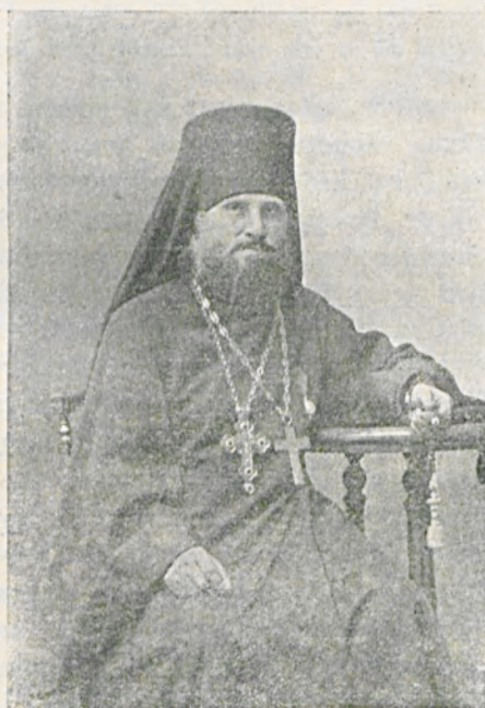
Архимандритъ Ионафанъ. † 24 февраля 1915 г.

Передъ туристомъ, совершающимъ путь на пароходѣ изъ Архангельска вдоль Мурмана, открываются суровыя картины арктической природы. Пустынный берегъ загроможденъ высокими, угрюмыми горами, замѣтно