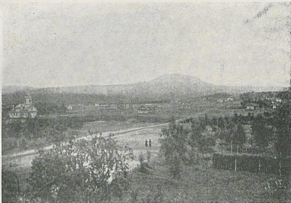
Общій видъ монастыря.

Нельзя сказать, чтобы почитатели монастыря обходили его въ своихъ пожертвованіяхъ. Но самъ о. Іонафанъ особенно цѣнилъ пожертвованія