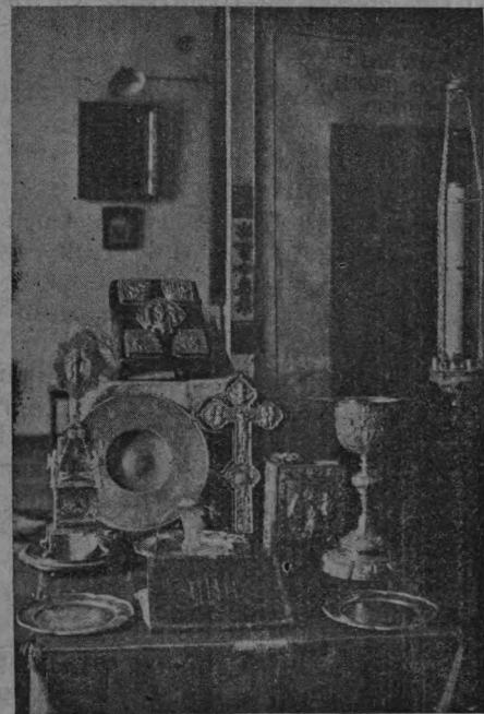
Церковная утварь придворно-походной церкви Императора Александра I.

Жертвеникъ также дубовый, складной, раскрывается и складывается какъ престоль. Высота жертвенника 1 арш. 6 верш., ширина—14 верш., длина—15 верш. Верхняя доска дубовая посредствомъ завѣсокъ складывается на половину.