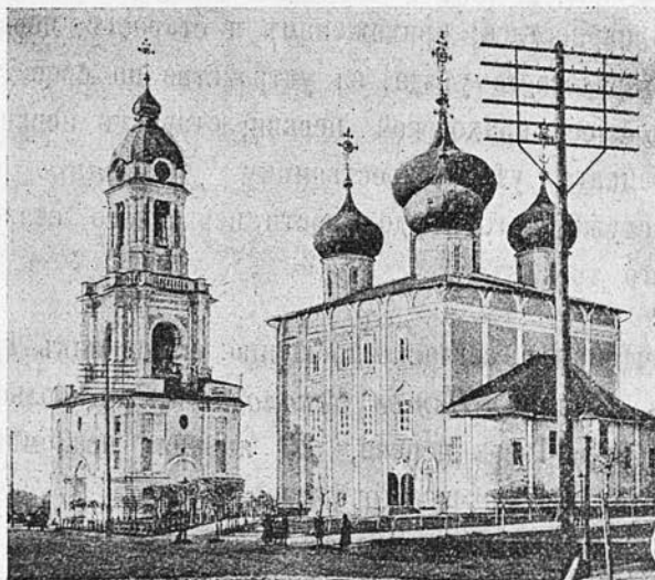
Тверской кафедральный соборъ.