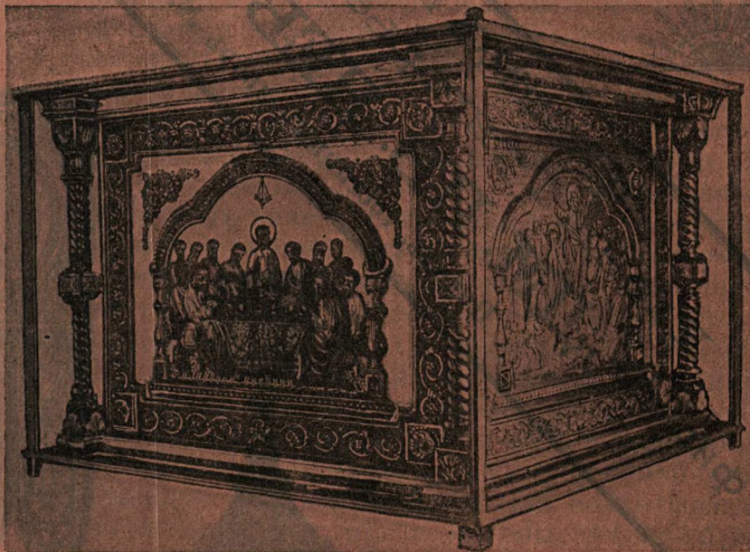
Одѣяніе на престолѣ металлическ. зеркальн. стекл.