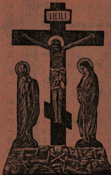
Крестъ на Голгофѣ.