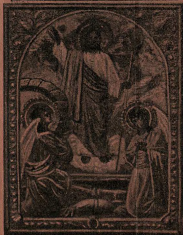
Образа въ ризахъ.