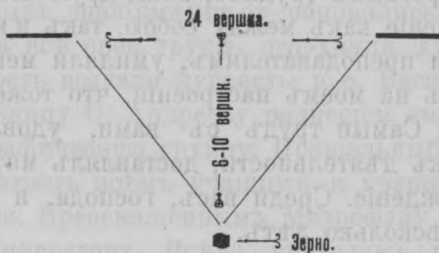
Схематическое изображеніе конусообразной ямки съ посаженнымъ зерномъ.