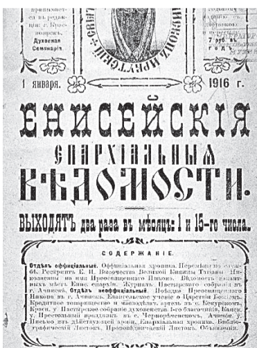
Енисейские епархиальные ведомости №1, 1916 год