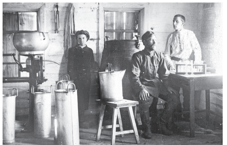
В сельской маслодельне