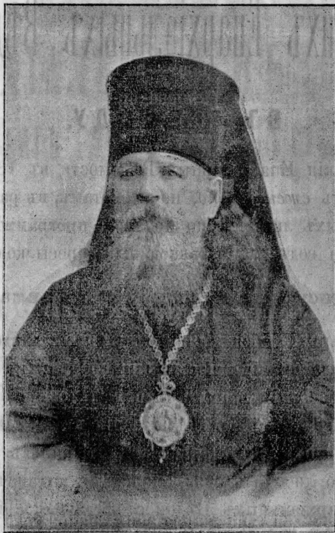
Преосвященнѣйшій Георгій, Епископъ Тамбовскій и Шацкій