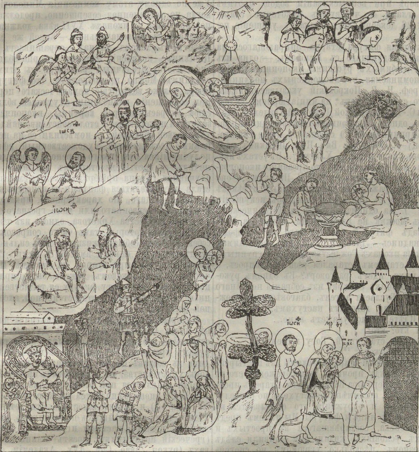
Рождество Господа нашего Ісуса Христа.

деніи Ею Спасителя.— Старопечатныя требники 42) „бабу“ эту упоминаютъ въ молитвахъ „бабѣ, пріемшей отроча“ („Господи І. Хр... бабою повитый пеленами“) и „бабѣ егда принесенъ будетъ Младенець крестити до сорока дней“ („Господи Боже нашъ... аки дѣтиць воспріять бывъ, самъ и сію