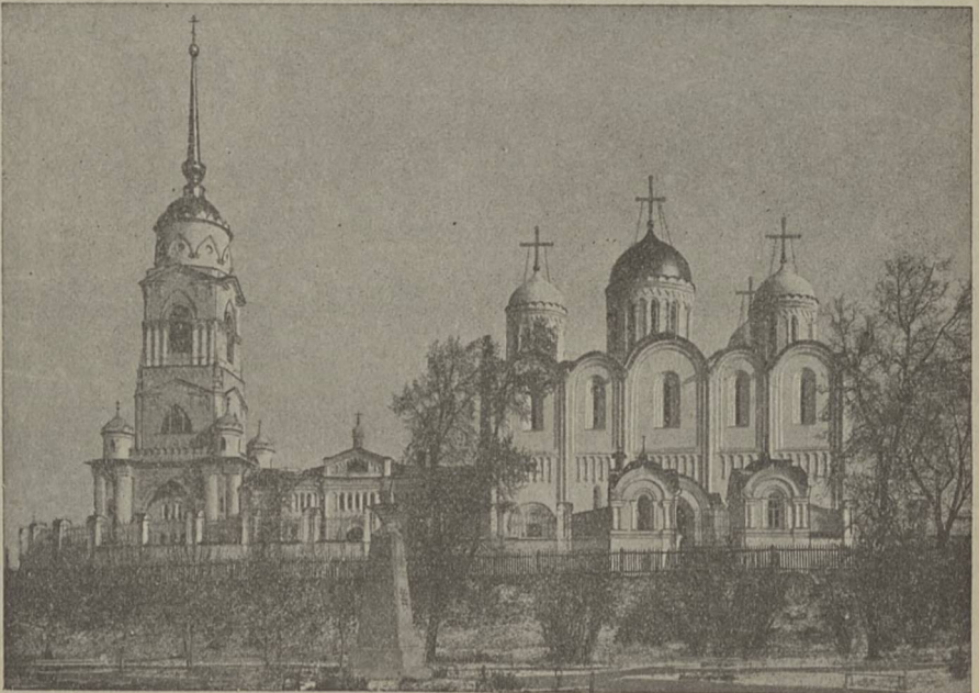
Скоропечатня И. Коиль.