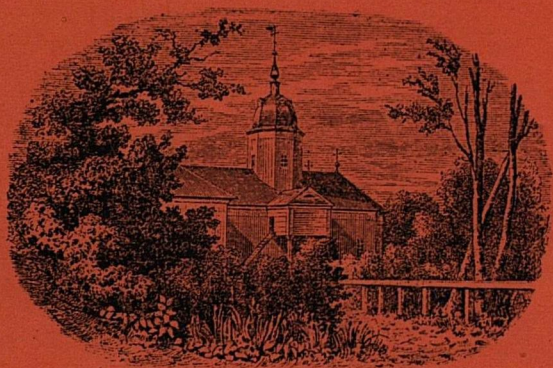
Церк. св. Іоанн. Божіеї дити. ст. в. поребенъ лесох. Вароеній.