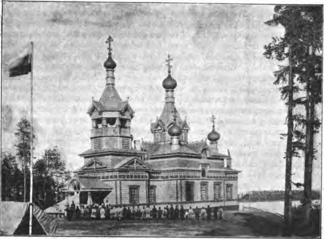
Видъ Кондостровской обители на Бѣломъ морѣ.