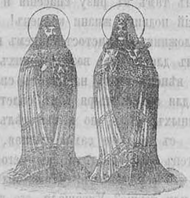
Св. Тихонъ. Св. Митрофанъ.