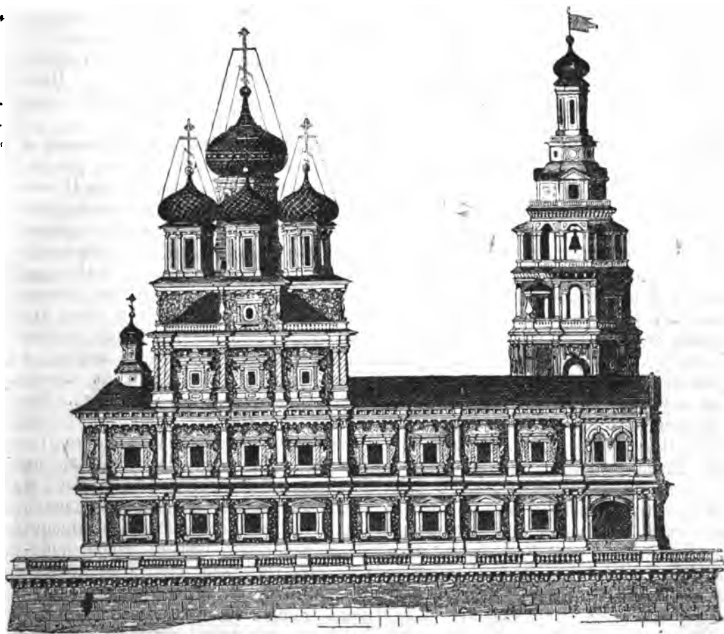
Строгановскій храмъ во имя Рождества Пресвятыя Богородицы въ г. Нижнемъ-Новгородѣ.

стройка. Оригинальный видъ Строгановской церкви еще больше выдѣляется оттого, что она построена на скатѣ горы и съ сѣверной стороны утверждена контрфорсами въ видѣ террассы, такъ что вся церковь представляется какъ бы стоящею на пьедесталѣ. Въ этомъ храмѣ замѣчательны мѣстные образы Спасителя и Богоматери, писан-