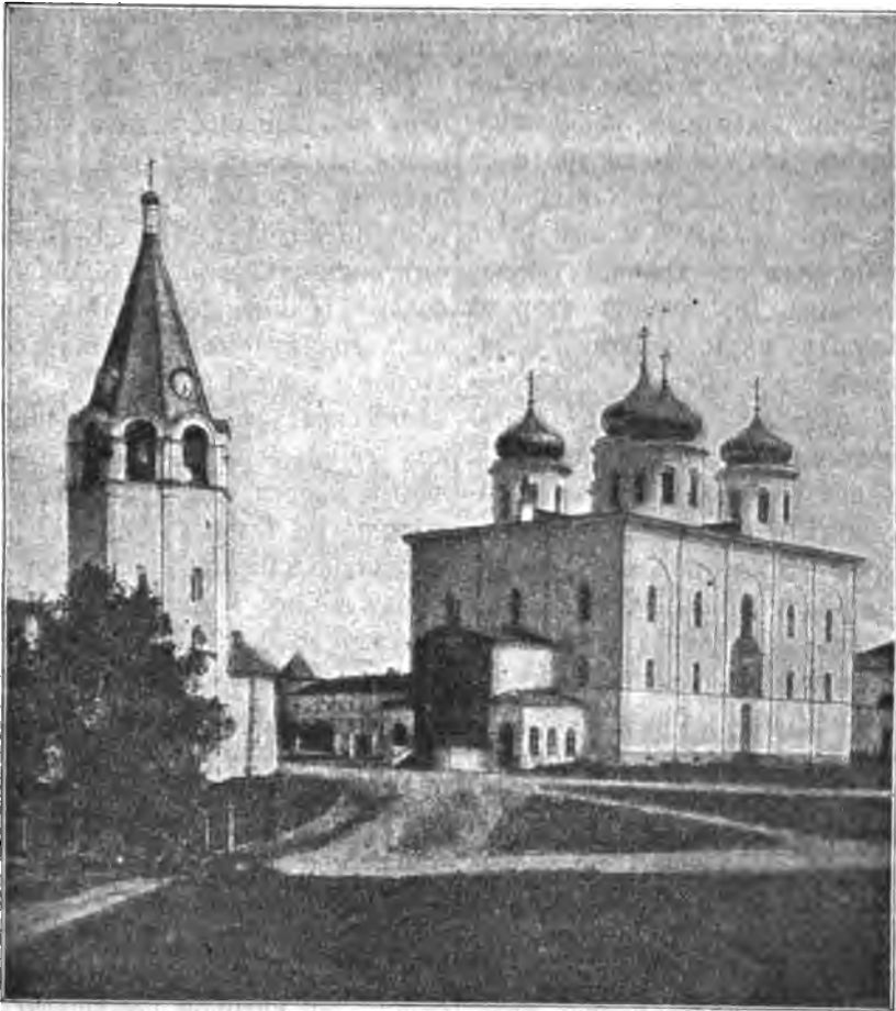
Спасо-Преображенскій кафедральный соборъ въ Нижнемъ-Новгородѣ.

Посрединѣ сѣверной стѣны собора возвышается великолѣпный памятникъ надъ могилою знаменитаго Нижегородскаго гражданина и патріота Кузьмы Минина въ видѣ часовни въ древне-русскомъ стилѣ съ восьмигранною крышею, увѣнчанною бронзовою вызолоченною главою. Спустившись по