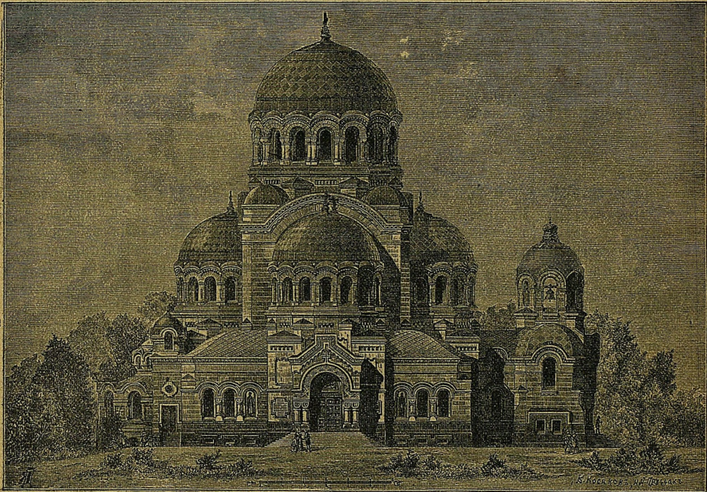
Строющійся храмъ во имя Милующей Божіей Матери и въ память Священнаго Коронованія Ихъ Императорскихъ Величествъ.

послѣ молебна о. протопресвитеръ въ рѣчи своей къ прихожанамъ призывалъ ихъ къ согласному дѣйствованію въ духѣ любви и мира на пользу своего приходскаго храма и выразилъ пожеланіе скорѣйшаго сооруженія новаго строящагося каменнаго храма во имя Милующей Божіей Матери. На цер-