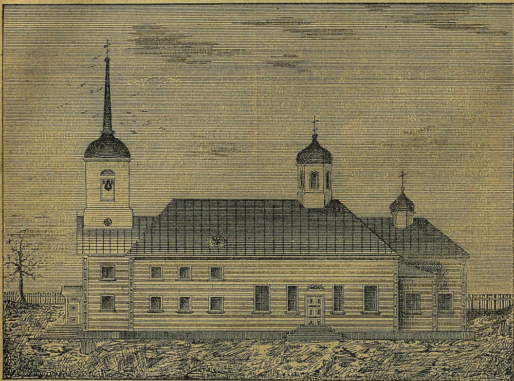
Храмъ во имя Святыя Живоначальныя Троицы въ Галерной Гавани

многократныя исправленія, нынѣ пришла уже въ большую ветхость; въ виду сего, а также недостаточной вмѣстительности стараго деревяннаго храма сооружается въ Гавани новый обширный каменный храмъ во имя Милующей Божіей Матери и въ память Священнаго Коронова-