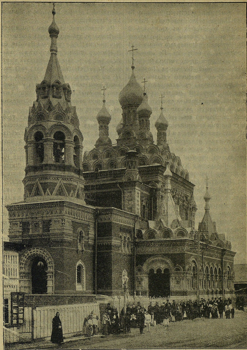
Церковь во имя Пресвятыя Богородицы, всехъ скорбящихъ Радости, что на Сте- бянномъ, въ С.-Петербурѣ.