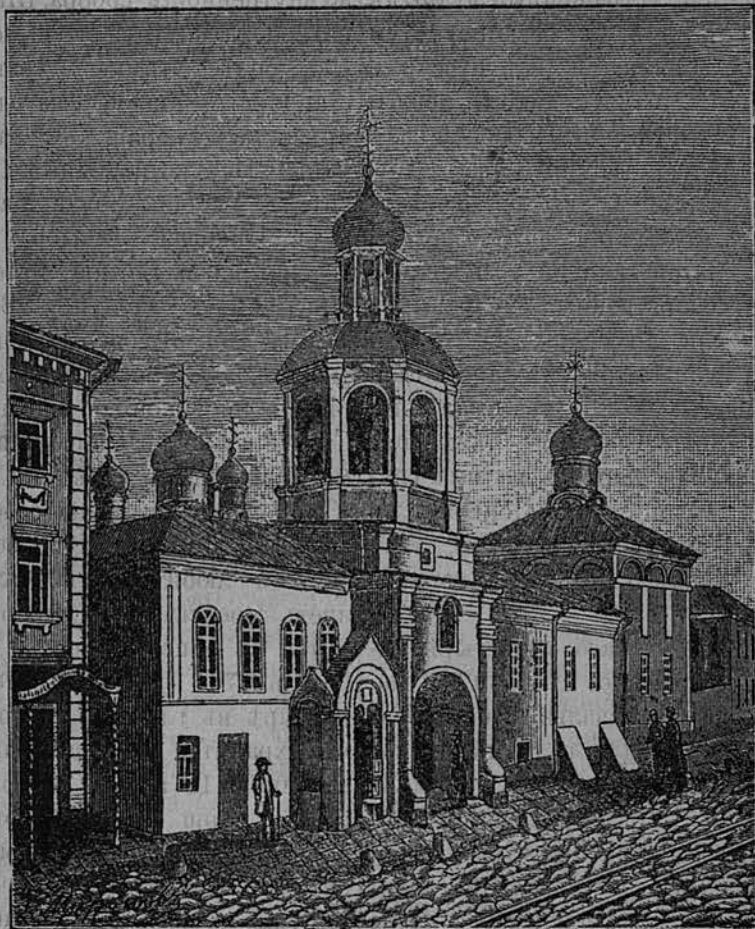
Срѣтенскій монастырь въ Москвѣ.