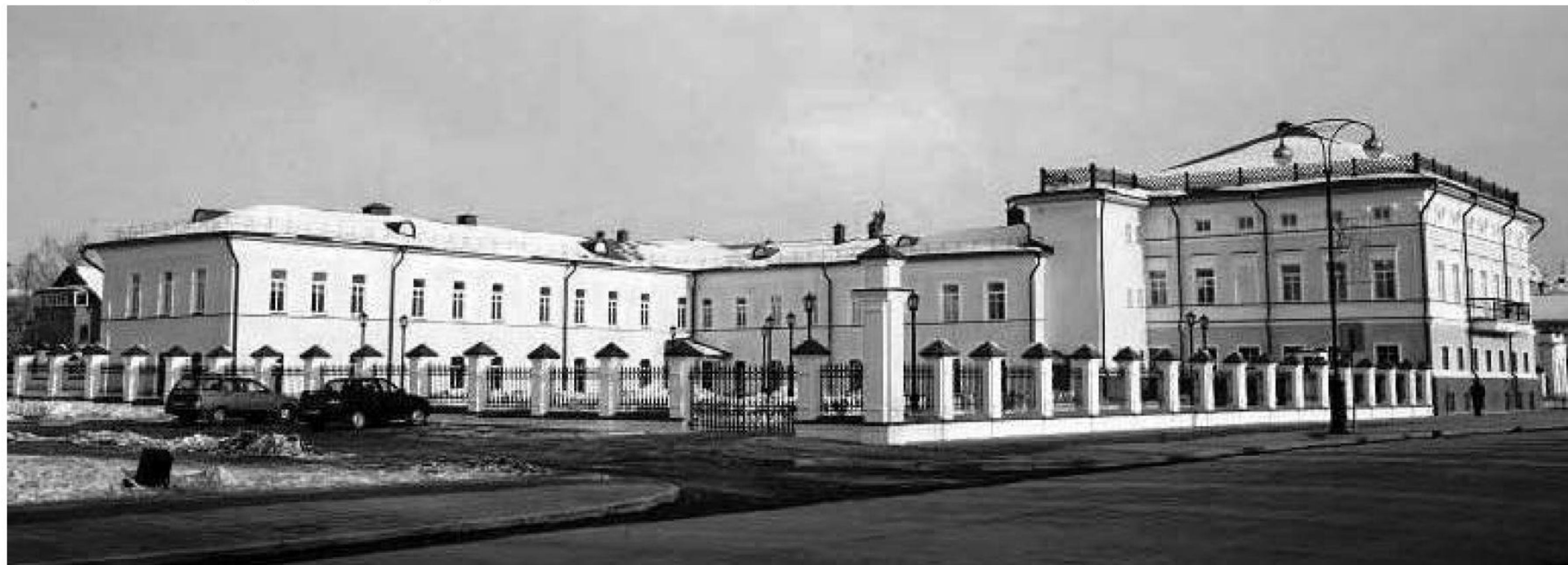
► Здание бывшего Тобольского епархиального женского училища.

(Продолжение следует). Елена НОВИКОВА, г. Санкт-Петербург