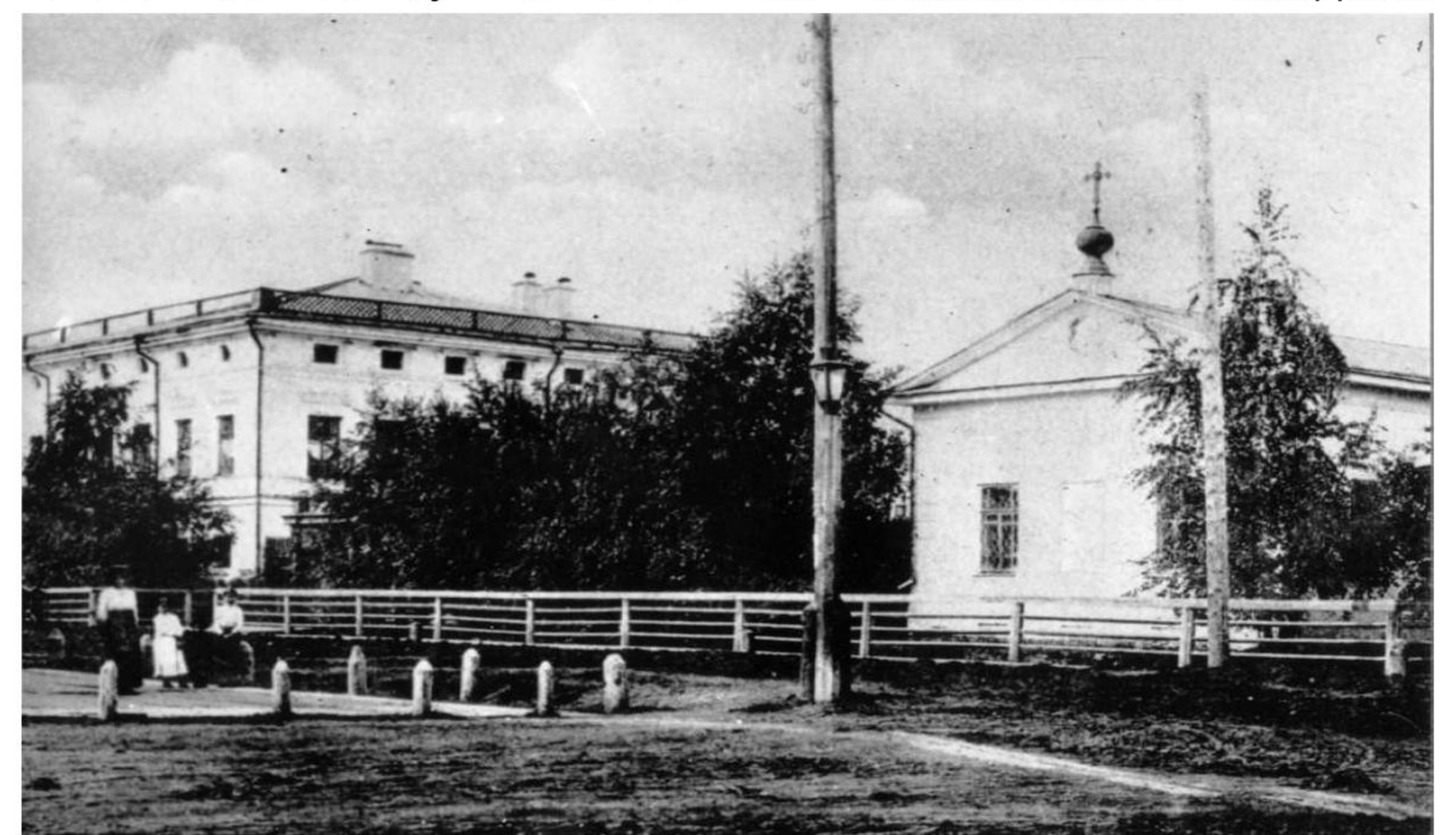
Тобольское епархиальное женское училище // Фото из Интернета

В первых училищах для дочерей духовенства система образования сводилась к получению определённых навыков и азов грамотности, необходимых для скромной жизни в замужестве за сельским священником. Однако время шло, и требования общества к жене священника постепенно возрастали. По мнению священнослужителей того времени, девице духовного звания уже недостаточно было быть только доброй матерью, любящей супругой и опытной хозяйкой. Теперь она должна не только разделять труды мужа-священника по воспитанию детей, по управлению домом и хозяйством, но и стать ему помощницей в многотрудном пастырском служении. Жена священника, являвшаяся матушкой в приходе, должна быть готовой разделить горе и радость простого народа, поделиться с ним своими знаниями, опытом, нередко и деньгами. В её обязанности входило