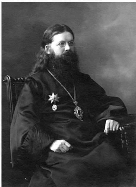
Священномученик Вениамин (Казанский), митрополит Петроградский

к выпускникам духовной семинарии 1900 г., появившаяся в церковной печати под названием «Куда я пойду». В ней ректор говорит с выпускниками как равный с равными, обращаясь к теперь уже бывшим ученикам: «Друзья мои» 17 .