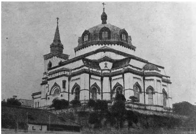
Собор Воскресения Христова в Токио (Николай-до)

образом, хорошо видно, что первые пять дореволюционных лет церковного развития в Японии шли довольно успешно, несмотря на то, что в связи с началом Первой мировой войны произошло значительное уменьшение финансовой поддержки из России.