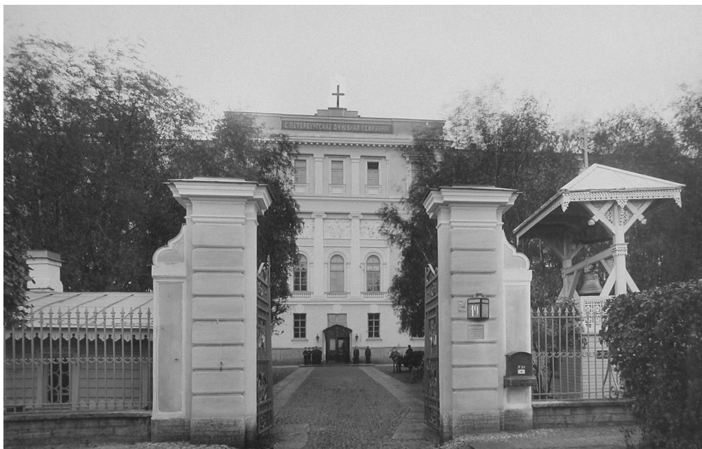
Санкт-Петербургская духовная семинария. Нач. XX в.