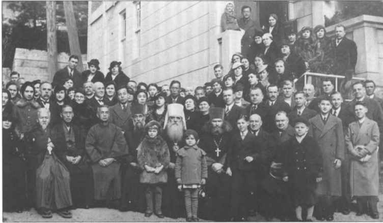
Православные японцы и русские эмигранты в Кобе. В центре – митрополит Сергий.

Сергий (Тихомиров) поддержал этот документ, что еще более усилило желание некоторых японцев добиться своей автономии. Искренне верующие японцы, воспитанные архиепископом Николаем в традиции непорочной апостольской веры, считали, что направленность Московского Патриархата на сотрудничество с богоборческой Советской властью очерняет Православие, и потому в 1927 г. по просьбе японской паствы владыка Сергий (Тихомиров) подал официальное прошение архиепископу Сергию (Страгородскому) о даровании независимости Японской Православной Церкви. Примерно через месяц он получил ответ, в котором говорилось, что: 1) архиепископ Сергий (Тихомиров) по-прежнему остается главой Японской Православной Церкви; 2) Японская Православная Церковь по-прежнему остается под непосредственным контролем Московского Патриархата; 3) митрополит Сергий (Страгородский) является патриаршим местоблюстителем и не имеет соответствующих полномочий для дарования церковной независимости 40 .