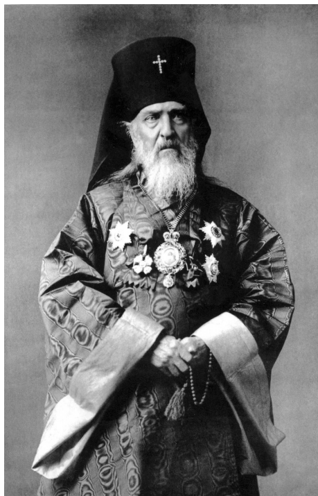
Святитель Николай Японский

Владыка Сергий (Тихомиров) прибыл в Японию 14 июня 1908 г. Как уже было сказано, архиепископ Николай отнесся сначала к новому помощнику с большой осторожностью, поскольку получал множество писем из России, свидетельствующих якобы о неблагонадежности епископа Сергия: «... Я буду настороже... Долго-долго надо будет наблюдать и с осторожностью руководить» 27 . Впрочем, уже очень скоро опасения архиепископа Николая рассеялись. В Японии таланты епископа Сергия получили самые благоприятные условия для своего дальнейшего развития. Благодаря своей способности к изучению иностранных языков владыка Сергий освоил чужую речь так скоро, что уже через год мог бегло произносить проповеди на японском языке. Появление чужака, освоившего сложный японский язык с такой скоростью и легкостью, произвело на японцев сильное впечатление, и очень скоро владыка Сергий приобрел в их глазах авторитет, близкий к авторитету равноапостольного Николая Японского.