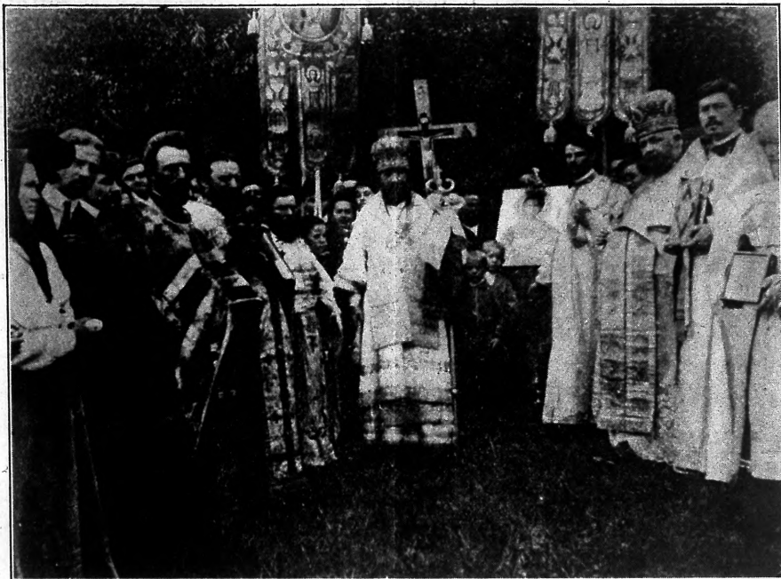
Крестный ходъ 13 Авг. въ Св. Тих. Обители.

ма къ келіи, гдѣ пребывалъ „готовящійся“. По „нынѣ отпущаеши“ заплѣли тропарь и наконецъ роздалось: „объятія отча“. Вывели прикрытаго власяницею брата и укравъ его отъ взора людей мантиями, направились въ храмъ къ соли, гдѣ стоялъ Архипастыръ Владыка, готовый яко чадолюбивый Отець пріять грядущаго, яко блуднаго сына кающагося, и облечь въ одежды ангельскаго чина, главу укра-