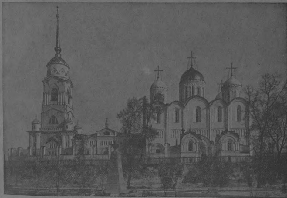
Скоропечатня И. Коиль. 1916 г.