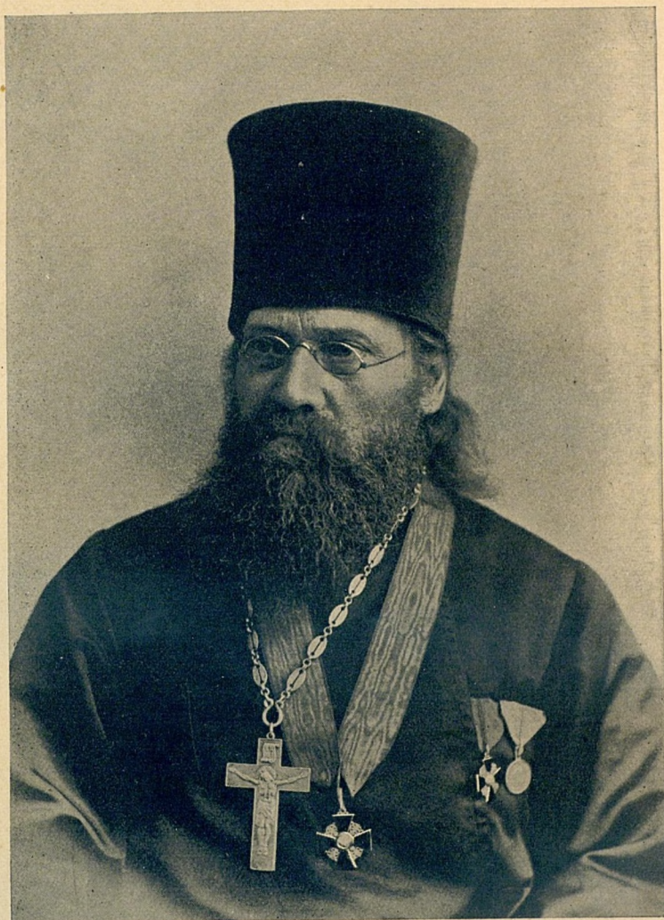
Протоіерей Петръ Степановичъ Мироносицкій

(род. 17 авг. 1843 г., скончался 25 марта 1904 г.)