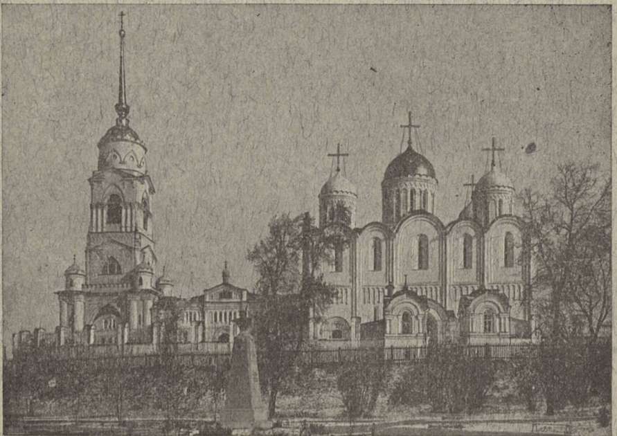
Губ. г. Владимиръ. СКОРОПЕЧАТНЯ П. КОИЛЬ.