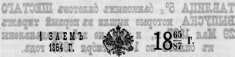
ТАБЛИЦА серий 1-го внутреннего 5% съ вы- игрышами займа 1864 г., вышедшихъ въ ти- ражи погашенія, начиная съ 1-го по 45 ти- ражъ, съ 1-го Юля 1865 г. по 1-е Юля 1887 г. ВКЛЮЧИТЕЛЬНО.