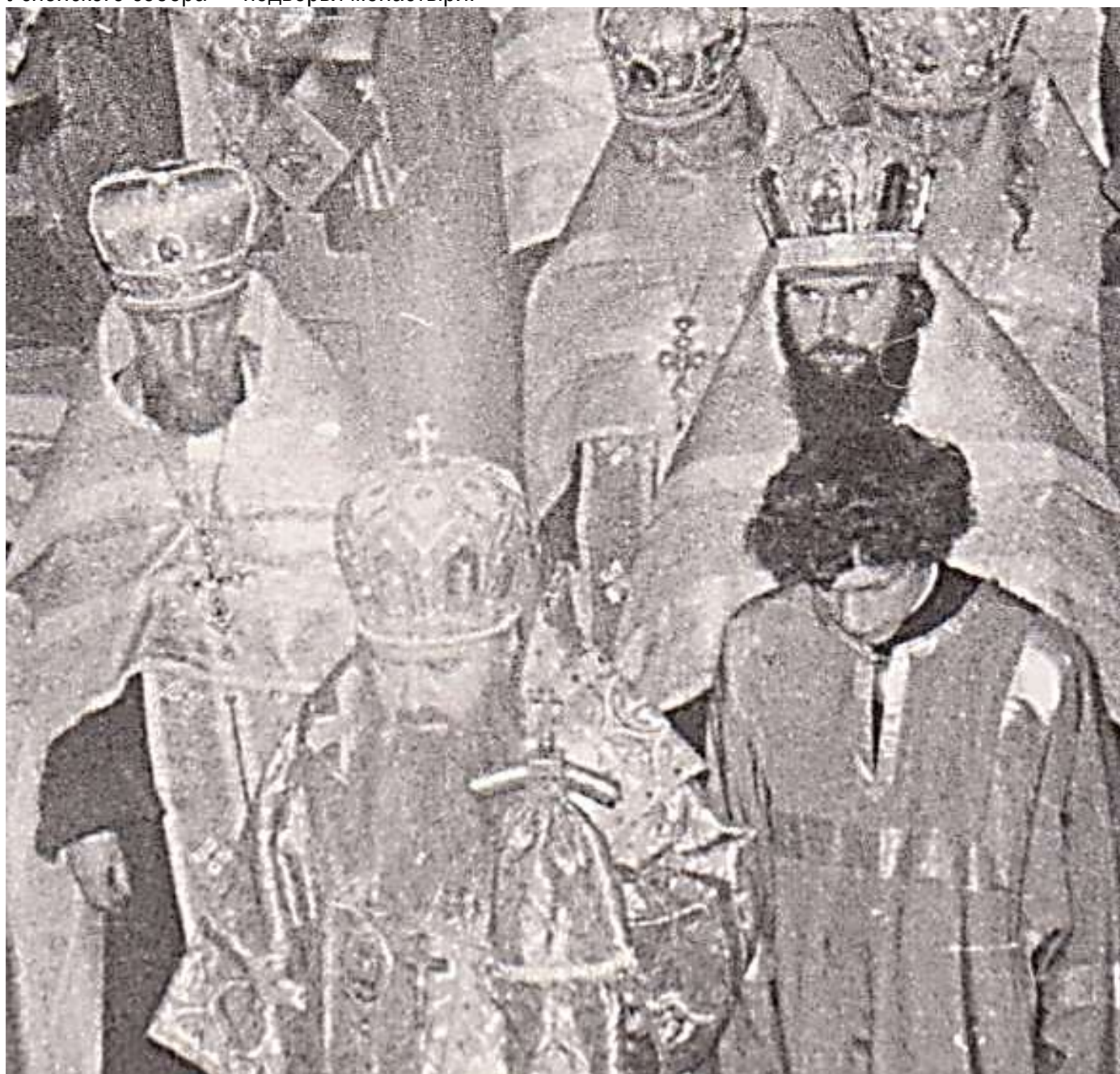
митрополит Никодим, слева архимандрит Иероним 1977год, апрель храм ап Филиппа в Новгороде

21 ноября 1997 года освобожден, согласно прошению, от должности наместника Саввино-Сторожевского монастыря с оставлением в должности заместителя наместника и настоятеля Успенского собора — подворья монастыря.