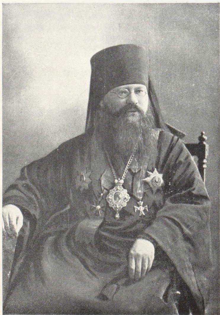
Его Преосвященство Преосвященнѣйшій Палладій, Епископъ Пермскій и Соликамскій.