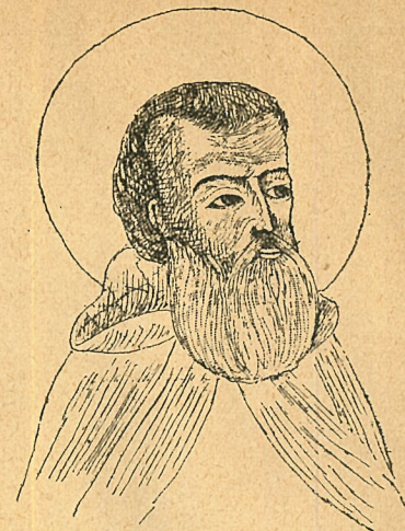
Преп. Варлаамъ Важскій.

Преподобный отецъ Варлаамъ «подобіемъ надсѣдъ, брада, аки Зосимы Соловецкаго, немного покорооче, ризы монашескія и въ схимѣ» 8 ).