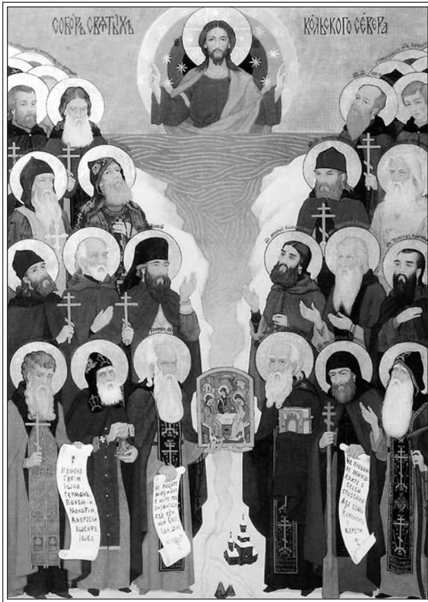
Собор Кольских Святых. Современная икона