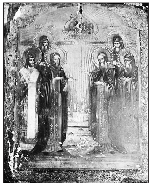
Икона, принадлежавшая причмч. Моисею

Вернувшись с Турьего мыса на асфальтовое шоссе, мы продолжили путь к Оленице. Сергей указал на крест при дороге: «Смотри, пересекаем Полярный круг». Полярный круг оказался просекой, прорубленной в направлении с запада на восток. Относительно него Кандалакша и Умба относятся к Заполярью, а основная часть Терского берега от Оленицы до Варзуги входит в дополярные пределы. Скоро мы миновали реку Оленицу и свернули в сторону моря. В XVI в. здесь была «живущая тона» — летнее поселение ловцов семги. Я представляла себе Оленицу прилепившейся к прибрежным скалам по подобию Умбы, но перед нами открылась широкая и ровная низменность, обрамленная смешанным лесом, в котором