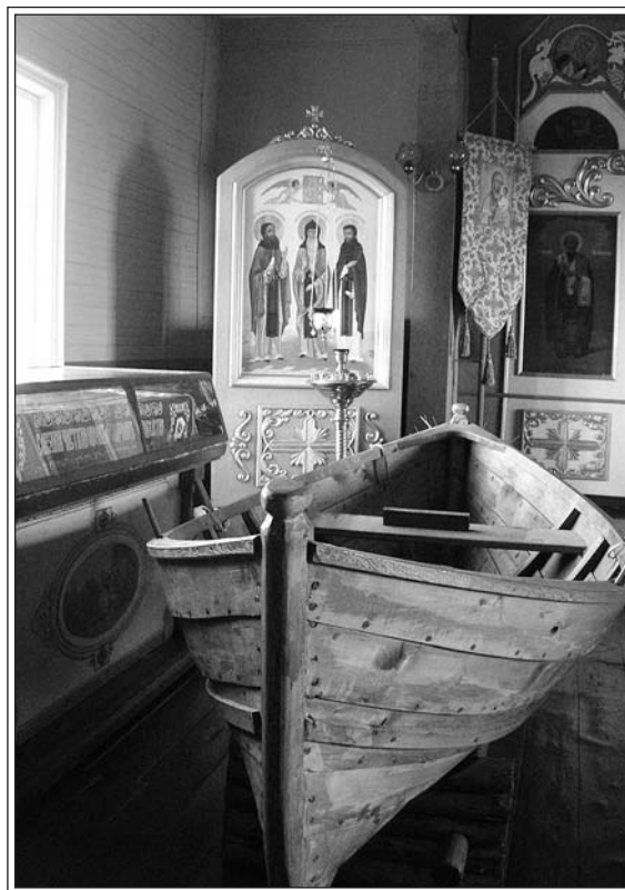
Внутри Тихвинской церкви в Кашкаранцах

Церковь Богоматери Тихвинской в 1932 г. была закрыта и отдана под клуб рыболовецкого колхоза «Передовик». В 2002 г. здание церкви возвращено Варзугскому приходу, и сразу же начались восстановительные работы. В настоящее время внутреннее убранство храма восстановлено в его прежнем великолепии, что и позволило совершить освящение Тихвинской церкви 15 октября 2005 г.