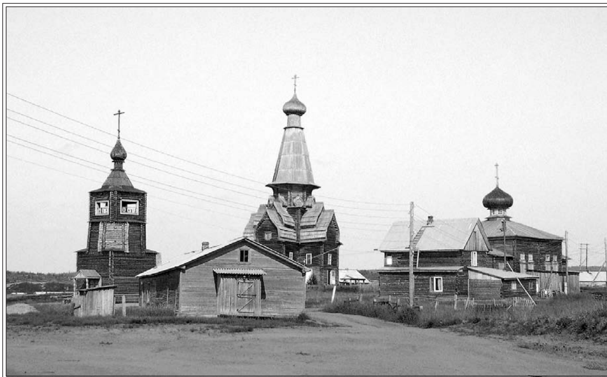
Варзуга. 2004 г.

найден на берегу и вытаскено из моря неводом при рыбной ловле» 7 . Собираясь на Терский берег, я нашла в интернете статью игумена Митрофана с интригующими подробностями, касательно этой истории. Дело было, по-видимому, в XVI в., когда мирские люди посещали эти места только во время промысла рыбы и морского зверя, а редкими постоянными жителями этих мест были соловецкие монахи-отшельники.