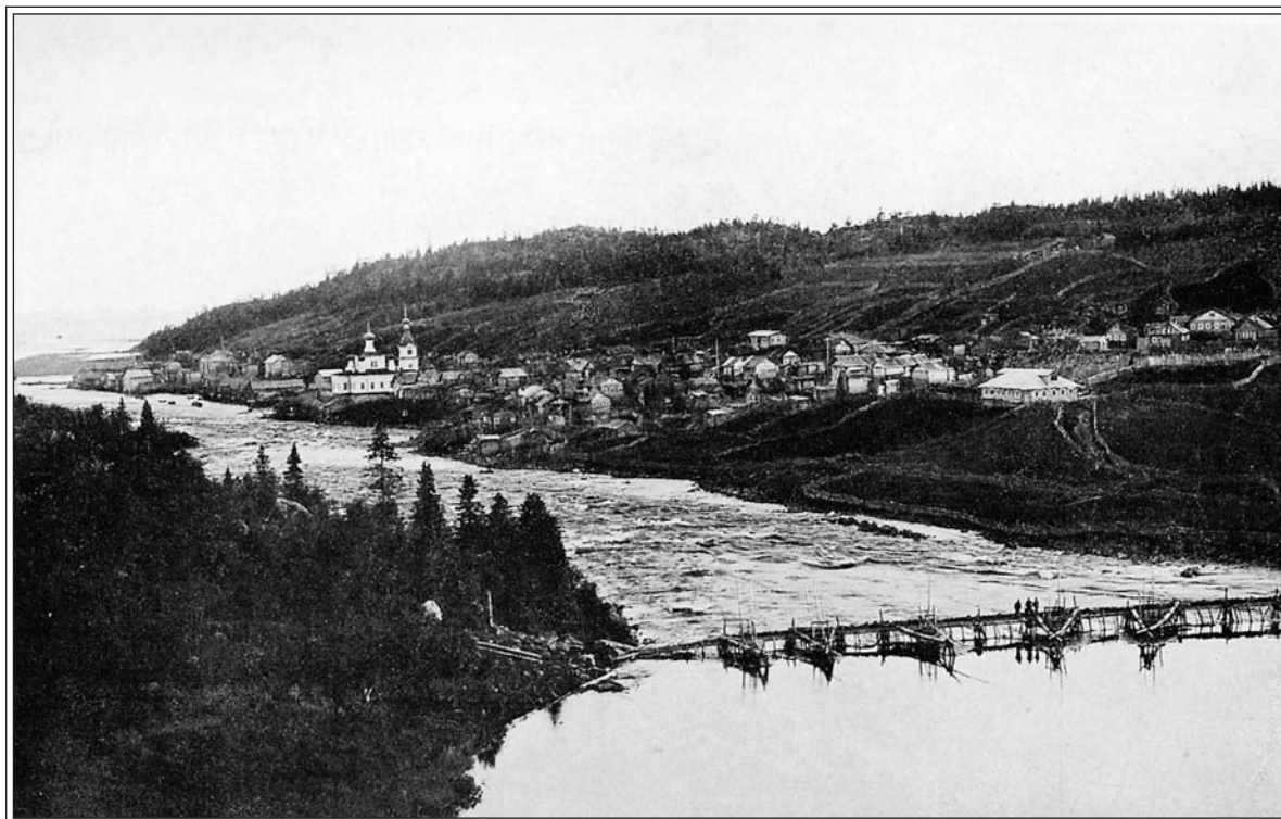
Умба. Фото Я. Лейцингера 1908–1911 гг.