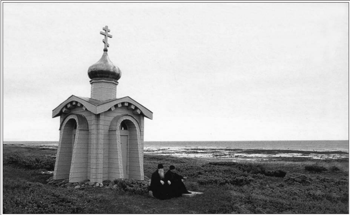
Часовня Безымянного инока Терского. Фото Г. Буздугана 2004 г.

ближайших к морю жилых дома со скотными дворами. Люди остановились перед неумолимо надвигающимися ледяными глыбами, и отец Михаил зашел: «Царице моя Препоблагая...», остальные подхватили: «Надежда моя Богородице...» Люди молились, но пение их было едва слышно из-за треска ломающихся льдин. И вдруг слова молитвы зазвучали в тишине — лед остановился. Невозможно было поверить, что ужас этой ночи позади, что родные Кашкаранцы спасены заступничеством Божией Матери. Отец Михаил приклонил колена перед иконой Царицы Небесной, и за ним каждый из жителей со слезами благодарил скорую Заступницу.