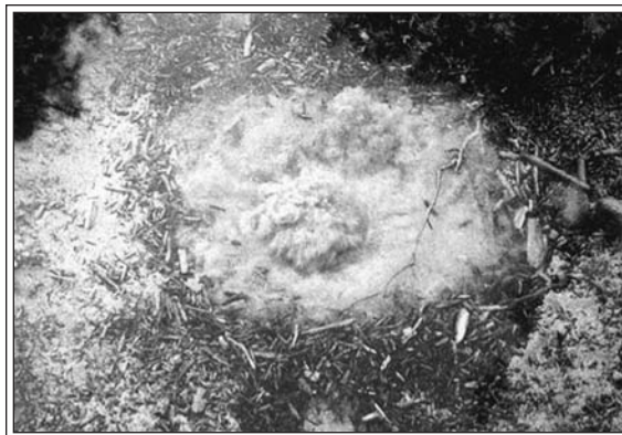
Игра воды в Князь-Владимирском источнике

На высоких берегах реки на переправе стоят два креста, на них и правят лодчонки. На нашей стороне под резной крышей-голубцом сияла икона Божией Матери «Леньковская» — «Спасительница на водах». Лодочка быстро подошла, и мы пустились в путь при сильном ветре. Трудно представить, как справляются эти «поездницы» со стихией во время осенних штормов. Оказавшись благополучно на правом берегу, мы условились с лодчиком о переправе обратно и стали подниматься по песчаному обрывистому берегу к кресту с иконой Святителя Николая. Поклонившись кресту и храмам, направились вдоль реки по деревенской улице с деревянными тротуарами по направлению к холму, над которым сиял «золотой крест». Минут через 20 мы уже достигли подножия креста на месте древнего городища. Он установлен «в память о первопроходцах Кольского Севера, монахах и мирянах Варзужского городища, отдавших свои жизни за веру Православную и державу Российскую в 1419 году от Р. Х.» Тогда пришли на это место около 500 «мурманов» и полностью уничтожили Варзужский погост. От креста открывается панорама Варзуги: улицы села привольно раскинулись в долине мощной реки с островком посередине. Вспомнив, что вчера на фотографии видела на островке стадо коров, я заинтересовалась, как же их туда доставляют. Оказалось, что коровы, помня о сочной травке на острове, сами бредут по перекату, а глубокие места переплывают. Наш путь к чудотворному источнику продолжался через