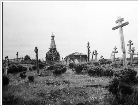
Варзуга. Фото начала XX в. Музей поморской культуры в Умбе