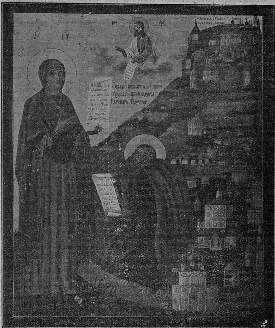
Преп. Трифонъ на молитвѣ за свой монастырь и градъ Хлыновъ.

Фотографическій снимокъ съ иконы, находящейся въ Вятскомъ женскомъ Преображенскомъ монастырѣ, а эта по- слѣдняя представляетъ копію съ древней иконы (XVII в.) на- ходящейся въ Вятскомъ Трифоновомъ монастырѣ, уже реста- вированной въ 1905 г.